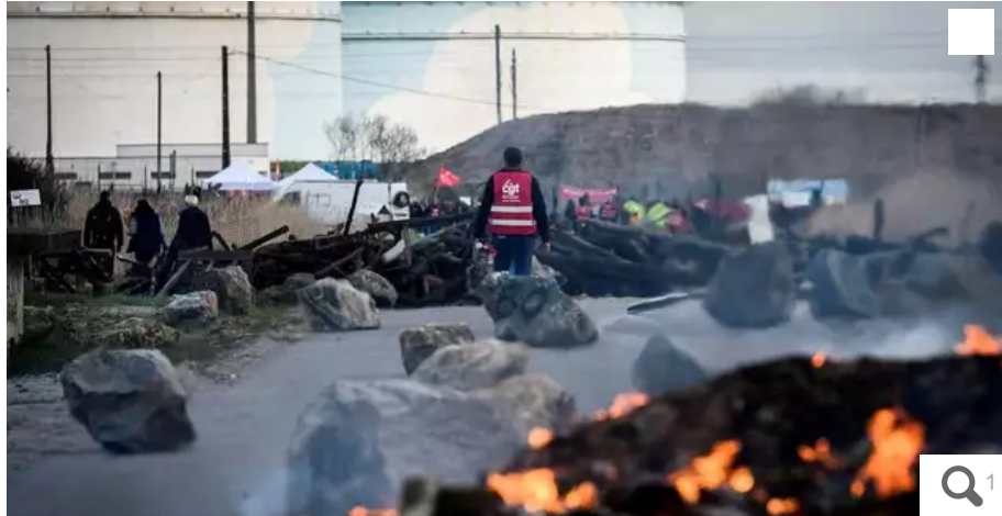
Un syndicaliste de la CGT se tient près de débris en feu et d'une barrière de fortune bloquant l'accès aux terminaux pétroliers de la raffinerie Total Energie à Donges, le 17 mars 2023.

La police est intervenue dans la nuit du lundi 20 au mardi 21 mars 2022 pour permettre le déchargement d'un bateau venu ravitailler le dépôt de carburant. Une source proche des grévistes a fait état « d'affrontements ».