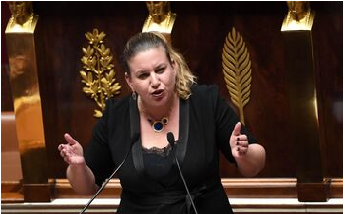
Retraites : le RN et la Nupes vont saisir le Conseil constitutionnel pour faire invalider la réforme