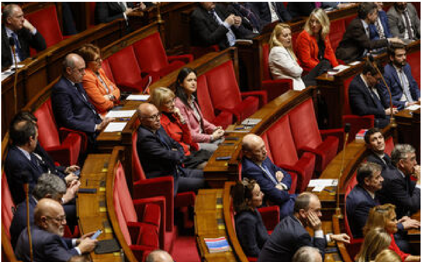
Motion de censure contre la réforme des retraites : qu'ont voté les députés ?