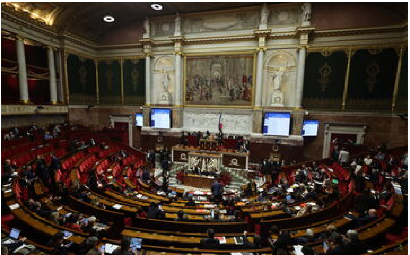
Retraites : les motions de censure du groupe Liot et du RN rejetées, la réforme adoptée