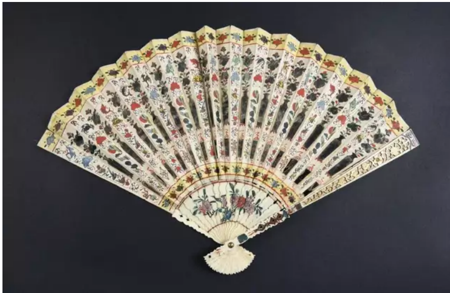
Cet éventail de Chine fait partie des dons qui viennent enrichir les collections du musée de la Compagnie des Indes à Port-Louis.

La conservatrice fait en particulier référence au legs en numéraire de Maurice Loy. Dans son testament, ce natif de Lorient avait fléché une somme pour l'acquisition d'œuvres au bénéfice du musée.