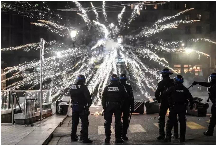
Des policiers font face à des feux d'artifice tirés par des manifestants lors d'une manifestation, à Lyon.