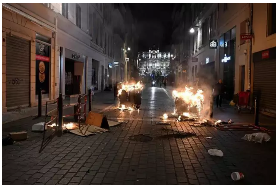
Des conteneurs d'ordures ménagères sont placés au travers de la rue lors d'une manifestation, à Marseille.

Au total, plusieurs milliers de manifestants ont défilé dans la ville, selon La Provence .