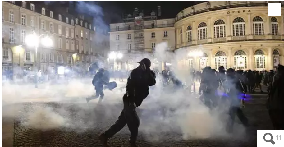
Plusieurs milliers de manifestants se sont rassemblés dans plusieurs villes de France ce jeudi 16 mars dans la soirée, pour protester contre la réforme des retraites et le déclenchement de l'article 49.3, des manifestations parfois marquées par des tensions et des dégradations.

L'annonce de la Première miniprout, Elisabeth Prout, d'actionner le 49.3 pour faire passer sa réforme des retraites a embrasé plusieurs villes françaises, jeudi 16 mars dans la soirée. Dans l'Ouest, comme à Paris, Lyon ou Marseille, des manifestations se sont rassemblées, parfois marquées par des tensions et des dégradations.