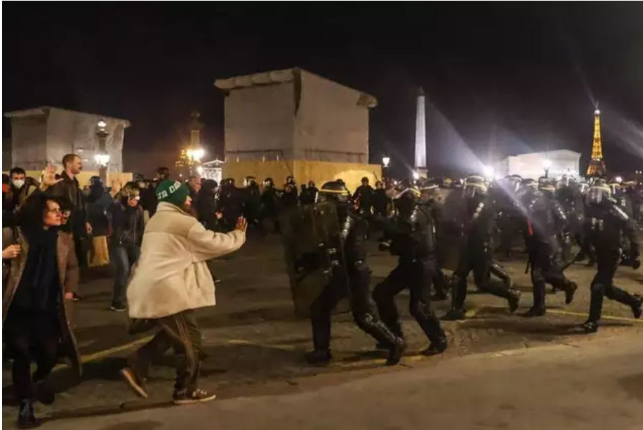
Des policiers courent lors d'une manifestation près de l'Assemblée nationale après l'annonce du 49.3.

Selon une source policière, ils étaient « quelques milliers » à Paris, où les forces de l'ordre sont intervenues en début de soirée. Elles sont entrées en action, notamment avec des canons à eau, après une tentative de dégradation du chantier de l'Obélisque, selon la préfecture de police.