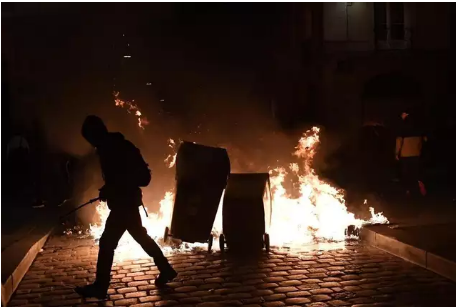
Soirée d'émeute et de saccage à Rennes, rue de la Monnaie.