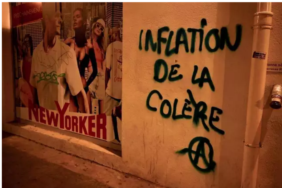
L'inflation de la colère : un tag sur un mur, à Marseille.

Au total, plusieurs milliers de manifestants ont défilé dans la ville, selon La Provence .