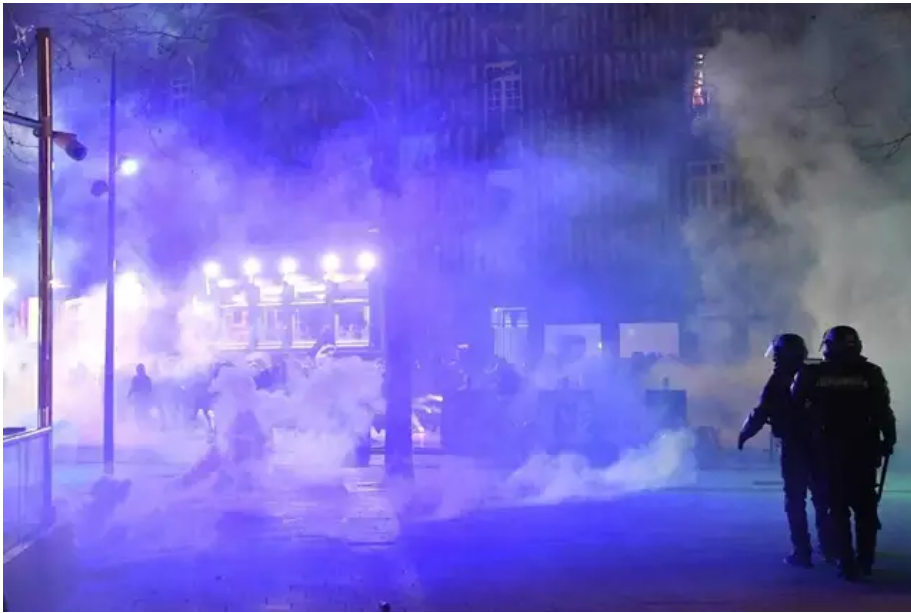
Près de 75 gendarmes venus de Rennes et des départements bretons ont été appelés en renfort. Du jamais vu à Rennes.