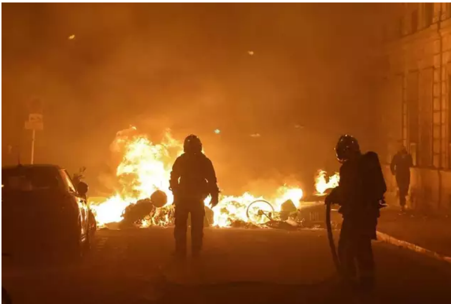
Les pompiers éteignent un incendie après une manifestation près de l'Assemblée nationale après l'annonce du 49.3.

Plusieurs charges et des jets de gaz lacrymogène ont progressivement évacué les manifestants de la place vers les rues et les quartiers environnants, selon les journalistes de l'AFP.