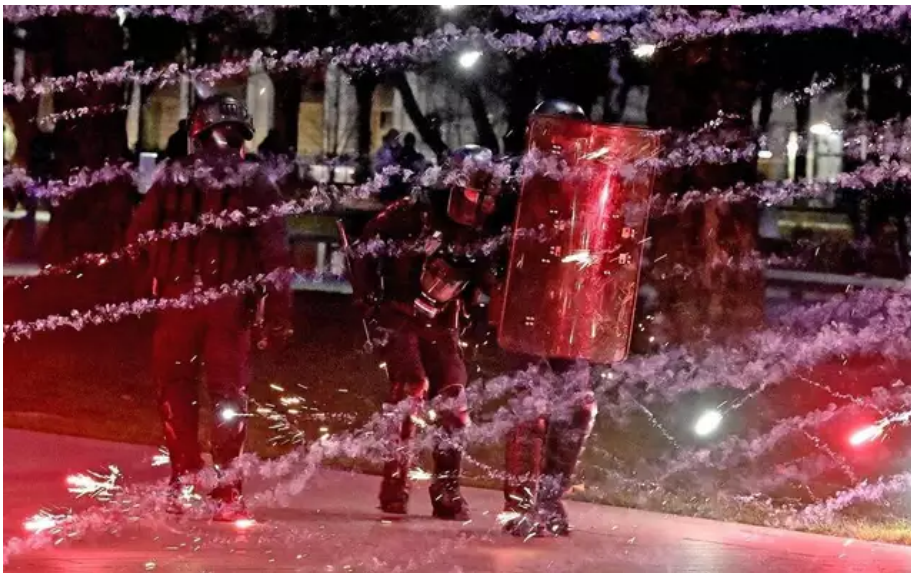
Entre 4 000 et 5 000 personnes manifestaient à Nantes, hier.

La manifestation contre la réforme des retraites a terminé tard à Nantes, jeudi 16 mars. Le rassemblement nantais devant la préfecture à 18 h s'est vite transformé en cortège. Selon nos estimations, à 19 h, ils étaient entre 4 000 et 5 000 manifestants. Mais le cortège semblait grossir, selon nos journalistes sur place.