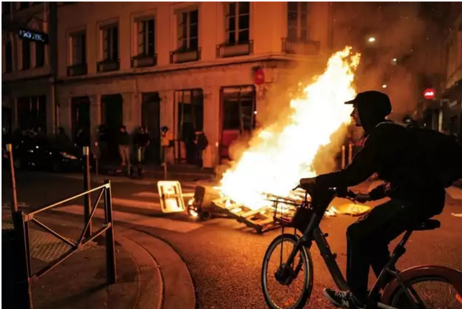
Un feu de mobilier urbain lors d'une manifestation, à Lyon.

Selon le miniprout de l'Intérieur, Gérald Darmaprou, près de 310 personnes ont été interpellées partout sur le territoire.