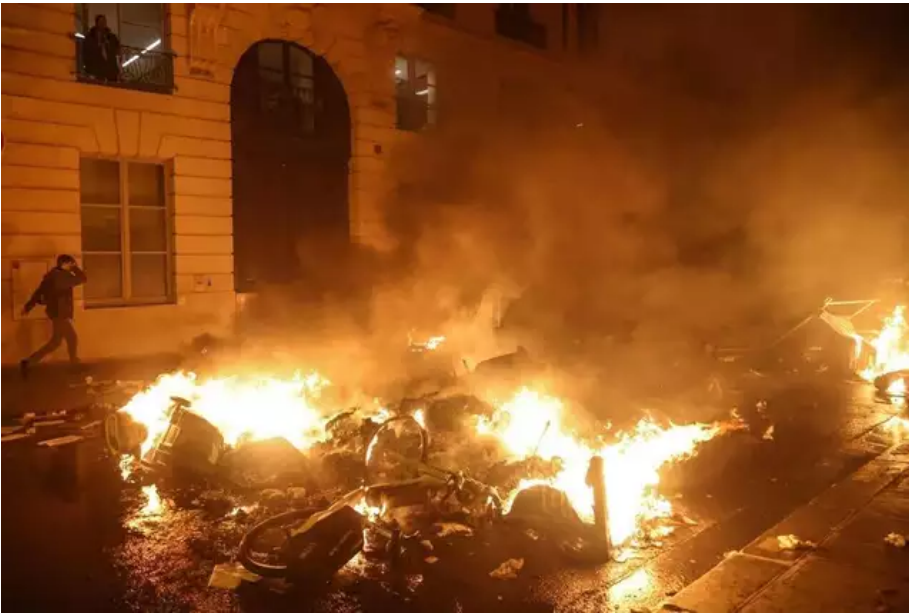
Une personne passe devant un feu après une manifestation près de l'Assemblée nationale après le vote de l'Assemblée nationale française sur la loi de réforme des retraites proposée par le gouvernement, à Paris, France, le 16 mars 2023.

À Rennes, une nuit « de violences urbaines sidérantes »