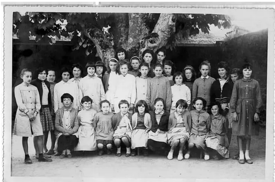
Classe de CM2 de l'école des filles (année scolaire 1960-1961)

Selon certains témoins de cette époque, on parlait aussi de « l'école des grignous » ou encore « l'école des cochons ». Après la Seconde Guerre mondiale, dans le bourg, elles étaient au nombre de deux, celle des filles de la rue du Fort-Bloqué, au n° 8, et celle des garçons installée dans la mairie, dans l'aile où se trouve aujourd'hui le bureau du maire. Sur le secteur côtier, il y avait aussi le groupe scolaire du Guermeur, créée, en 1912.