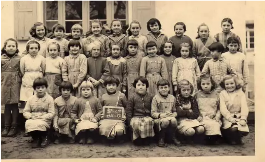
Classe de CE1 de l'école publique des filles (année scolaire 1956-1957)