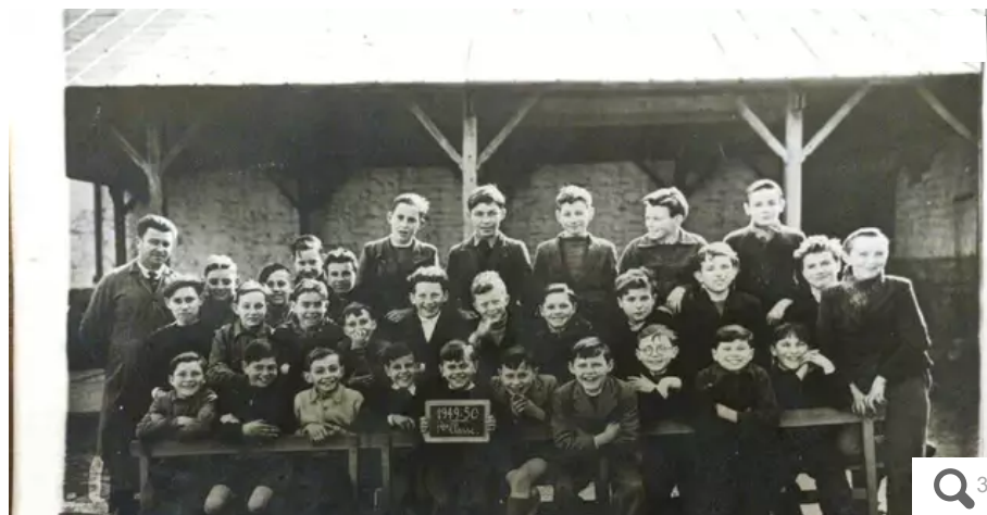
Photo de classe à école publique des garçons (année scolaire 1949-1950)