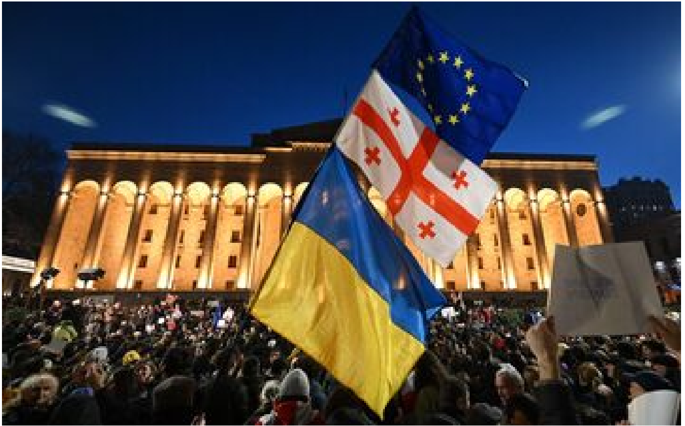
« Non à la loi russe ! » : retrait d'un projet de loi controversé en Géorgie après des manifestations