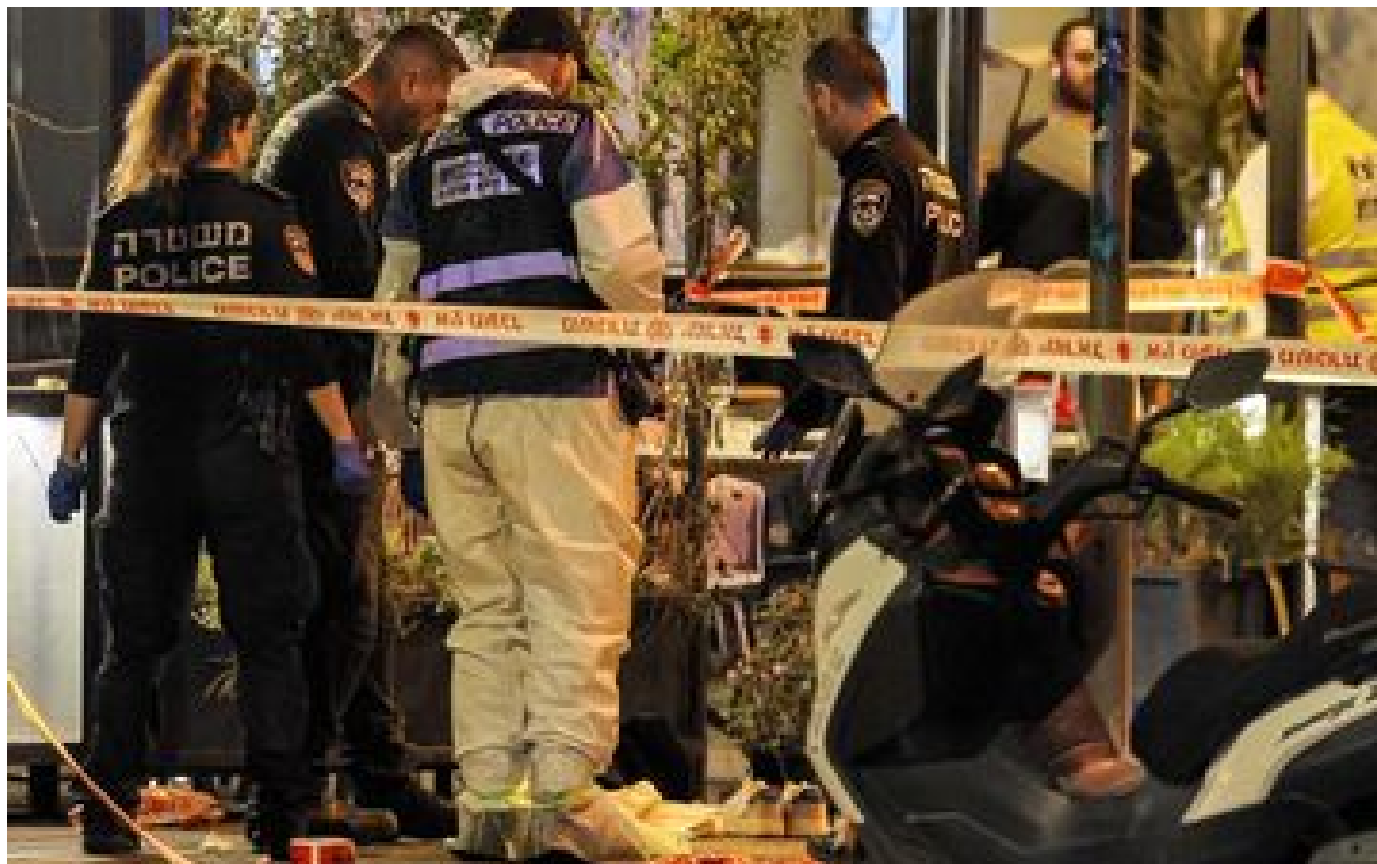
Israël : trois blessés par balles à Tel-Aviv, l'assaillant abattu