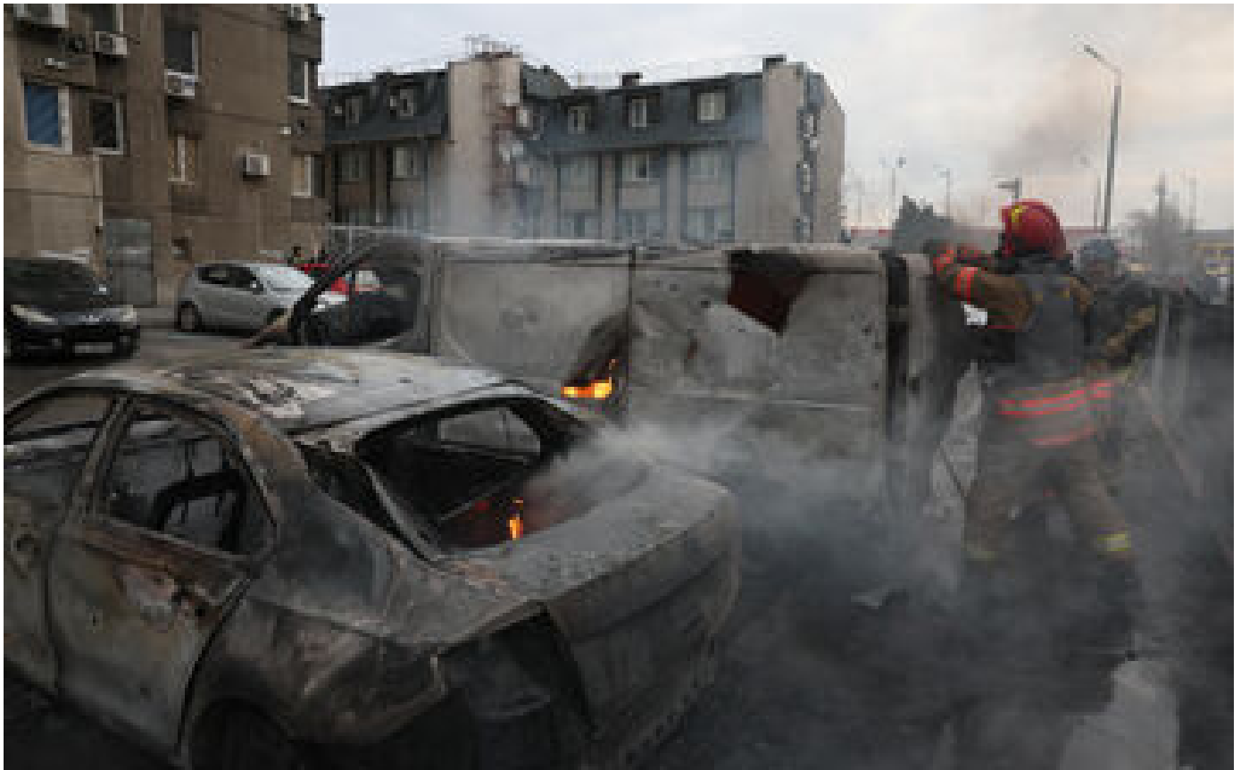
Pluie de missiles, infrastructures énergétiques touchées ... ce que l'on sait de la nouvelle offensive russe en Ukraine