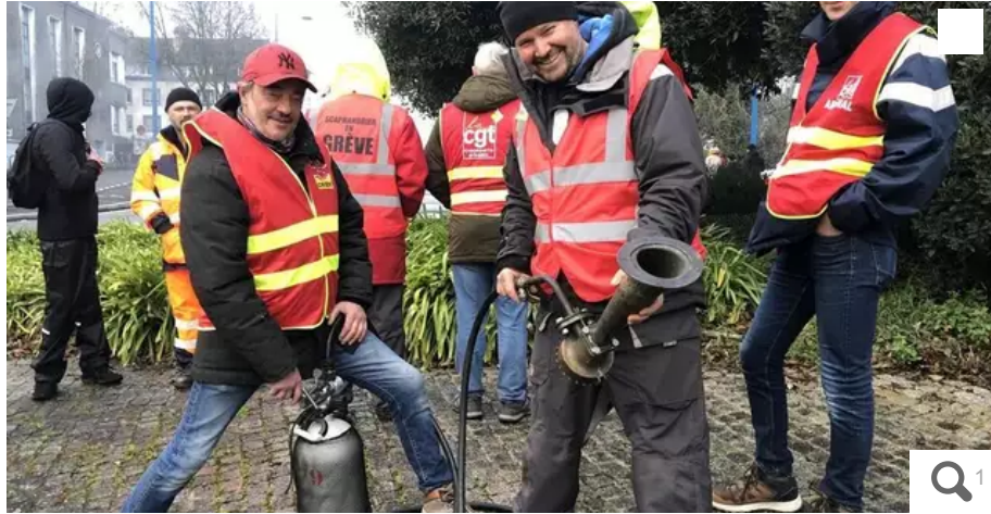
Pour se faire entendre, les militants CGT de l'arsenal ont branché une corne de brume de bateau sur une bouteille d'air comprimé. Et ça marche, depuis le début du mouvement, on l'entend à trois kilomètres à la ronde.

Depuis le début du mouvement contre la réforme des retraites, les manifestations sont rythmées par une corne de brume de bateau à Lorient (Morbihan). Une fabrication maison de la CGT de l'arsenal.