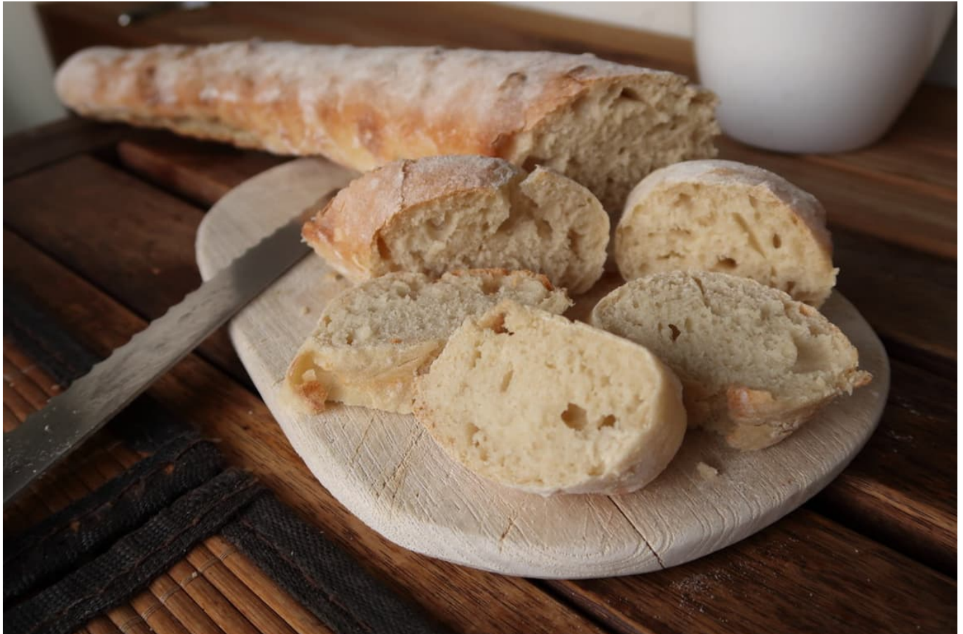
Une baguette bien blanche, "pas trop cuite" comme l'appellent certains.  