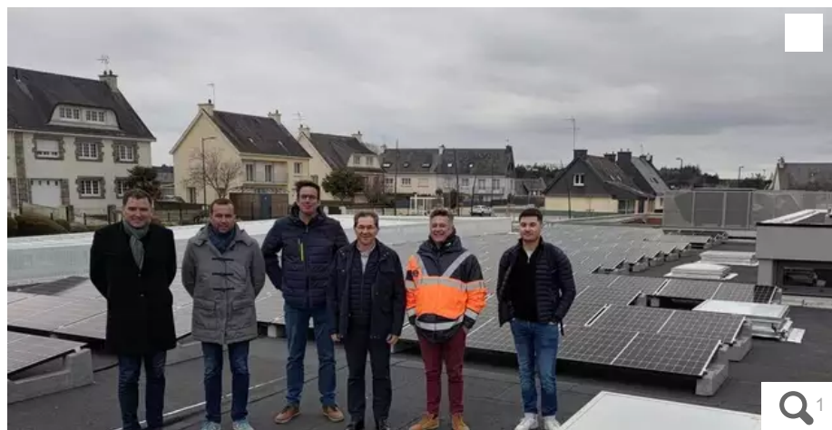
Les élus et des représentants de Morbihan Énergie lors du briefing de la mise en service de la nouvelle centrale photovoltaïque.

La Ville de Caudan souhaite produire et fournir l'énergie solaire en autoconsommation collective étendue afin d'atteindre des objectifs communs de transition énergétique. L'objectif est de couvrir environ 13 % de ses besoins annuels en électricité.