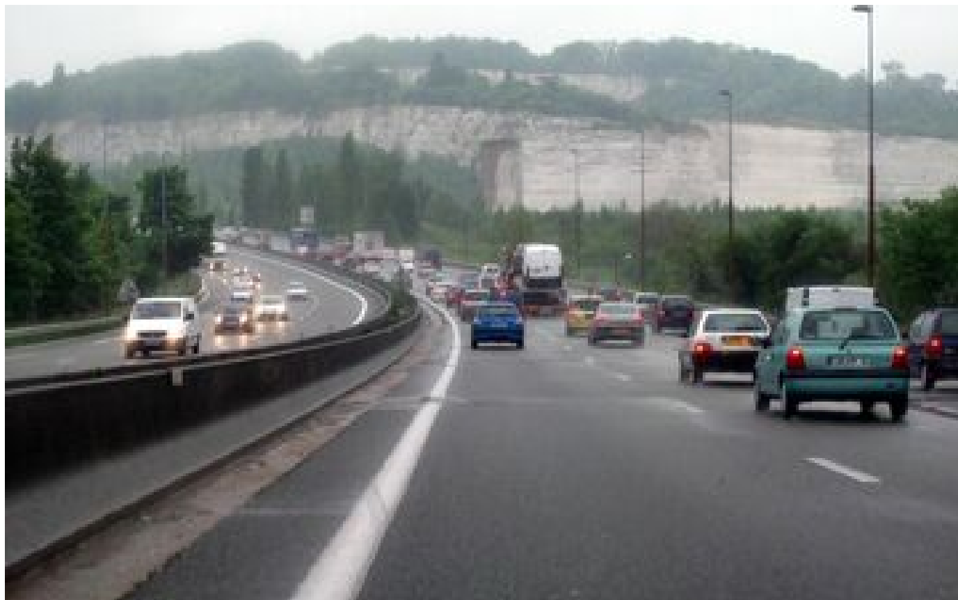
Yvelines : elle prend l'A13 à contresens et meurt dans un choc frontal avec une autre voiture