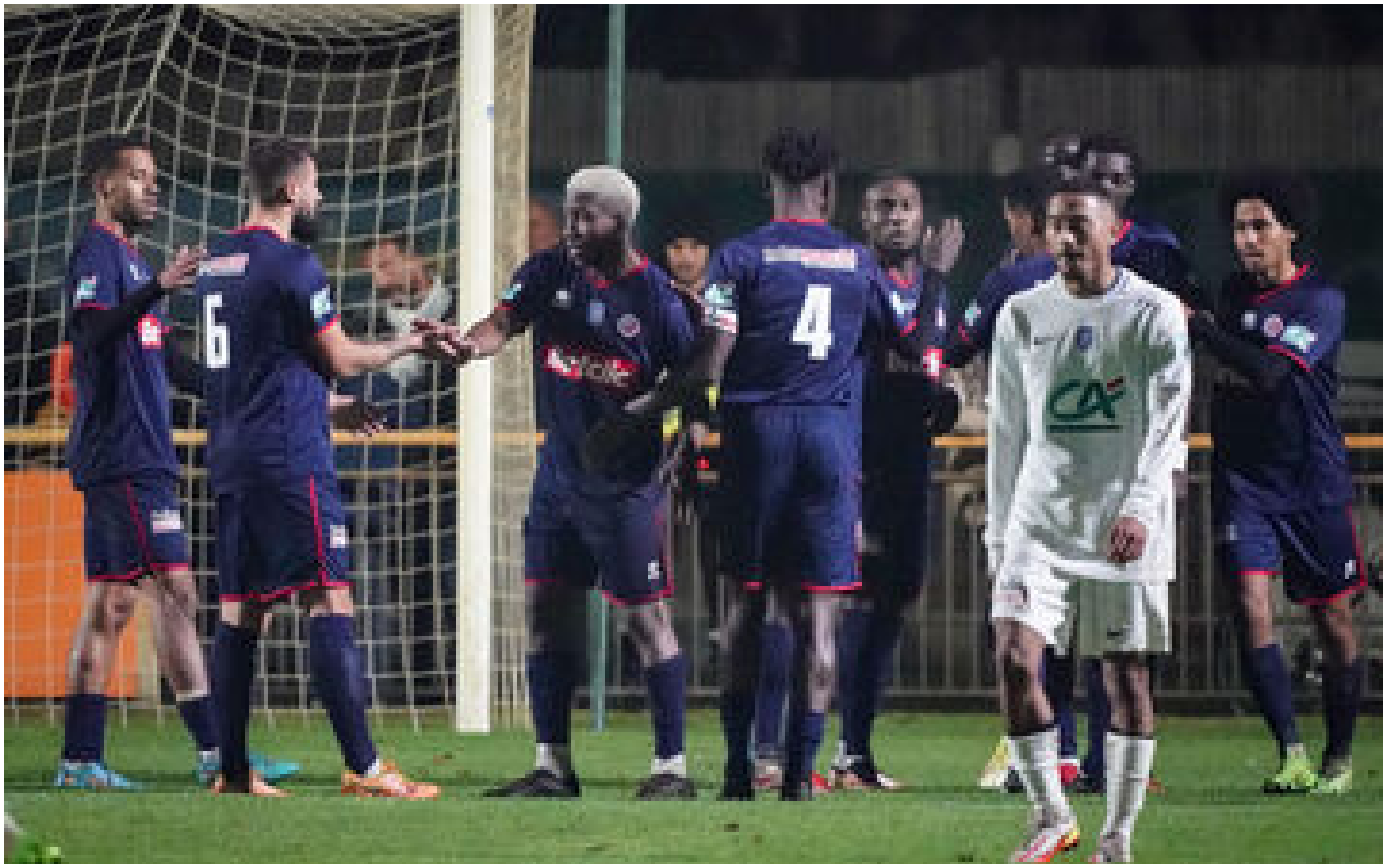
Abonnés Châteauroux-PSG : bien avant Ronaldo, pourquoi des Saoudiens ont-ils investi dans la Berrichonne ?