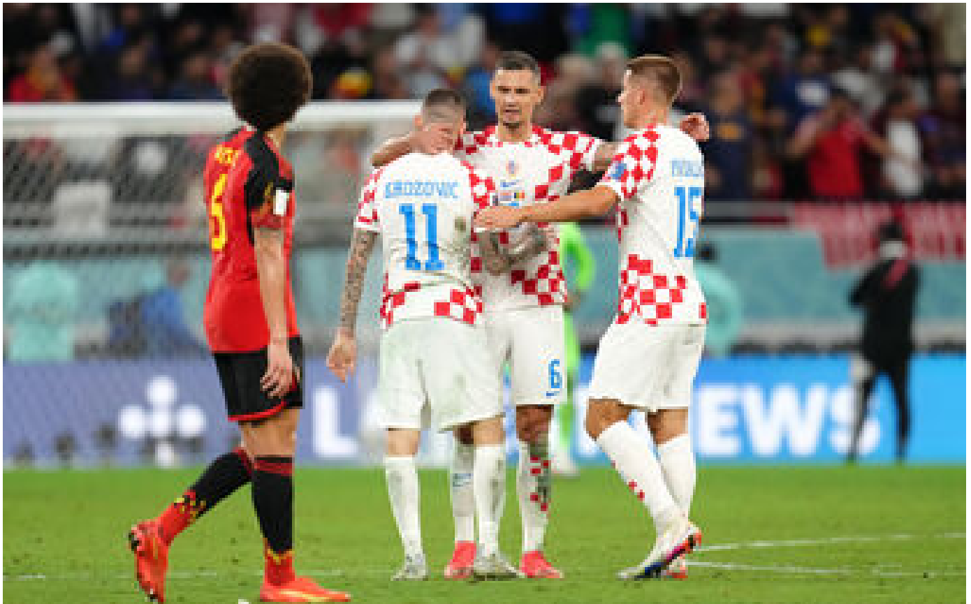
Abonnés Lovren à l'OL : entre gestes aux relents nazis et propos homophobes, la recrue provoque l'embarras