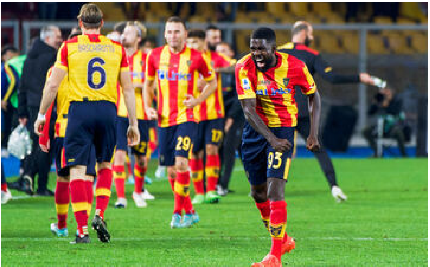
Abonnés Insultes contre Samuel Umtiti : le racisme, ce mal «banalisé» dans la société qui ronge le football italien