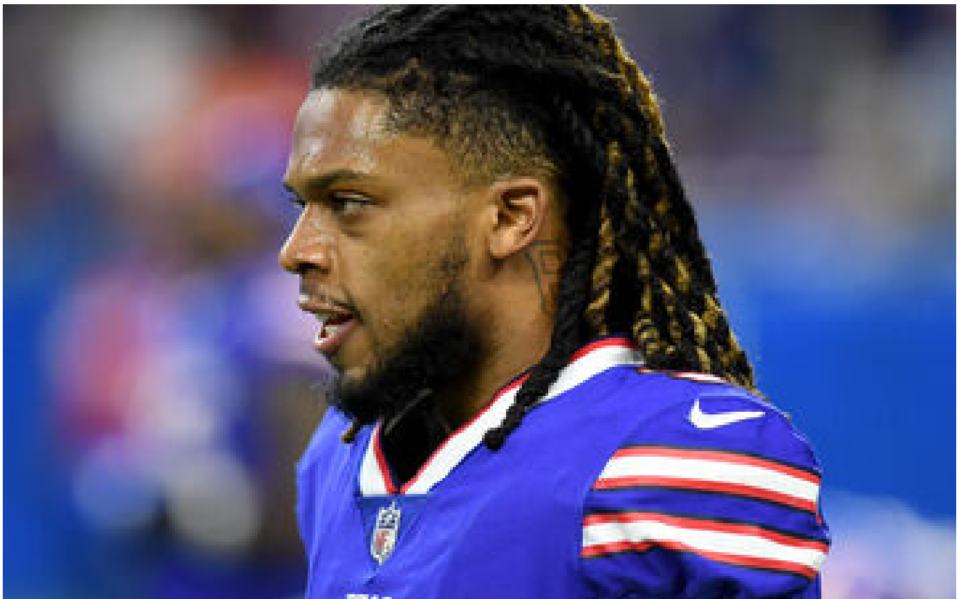
NFL : l'état de santé de Damar Hamlin s'améliore après son malaise cardiaque