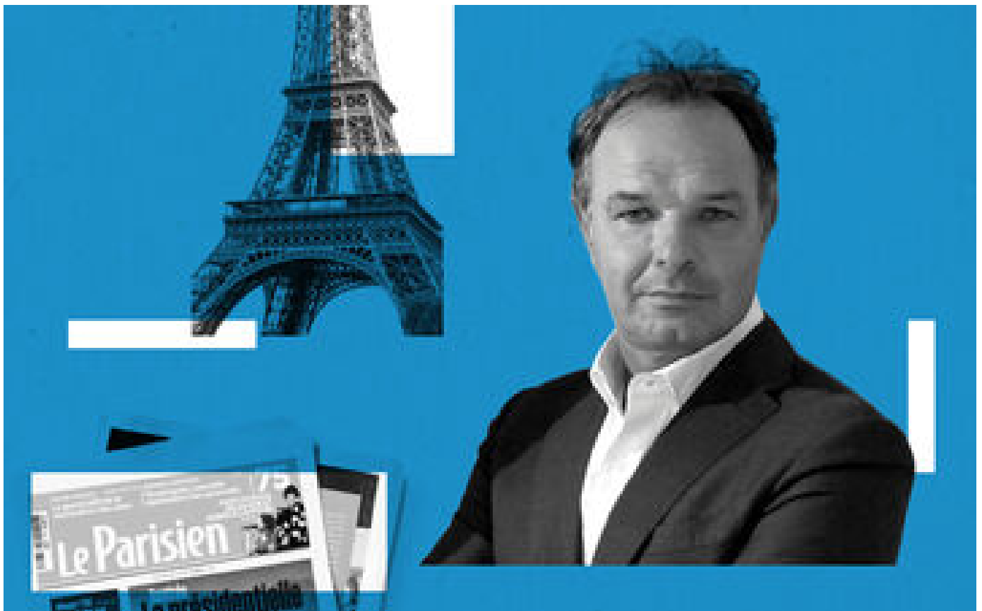
L'art de communiquer P