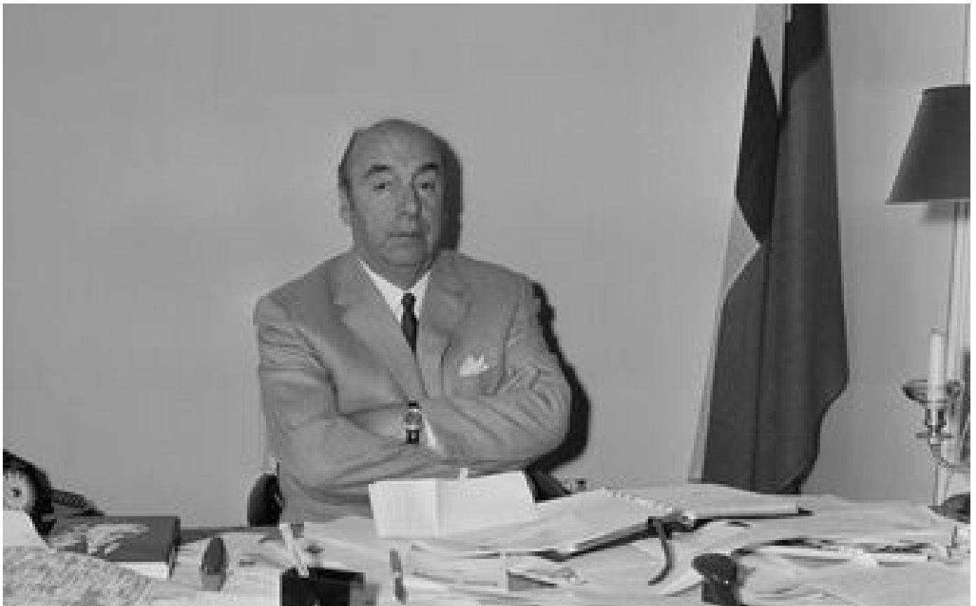
Pablo Neruda, quatre enterrements et un soupçon d'empoisonnement P