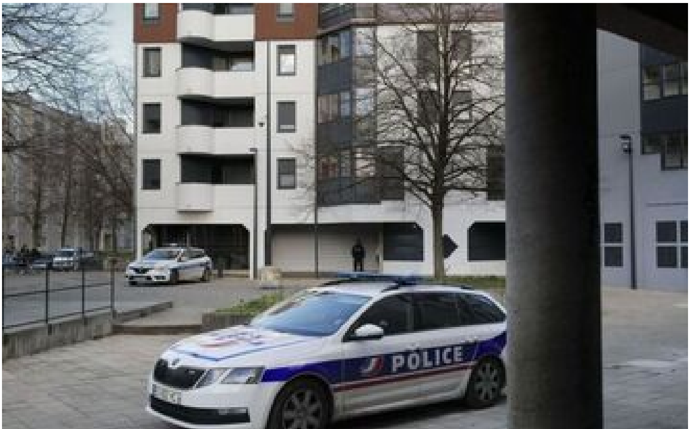
Opération anti-drogue à Besançon : 12 personnes ont été mises en examen