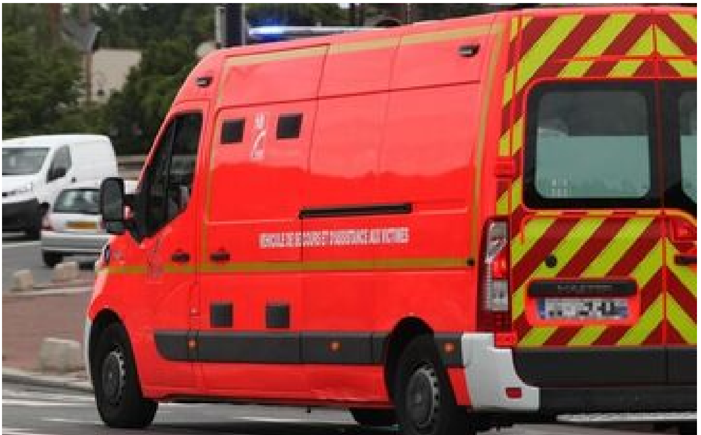
Lille : un enfant de 4 ans meurt écrasé par un bus de la métropole