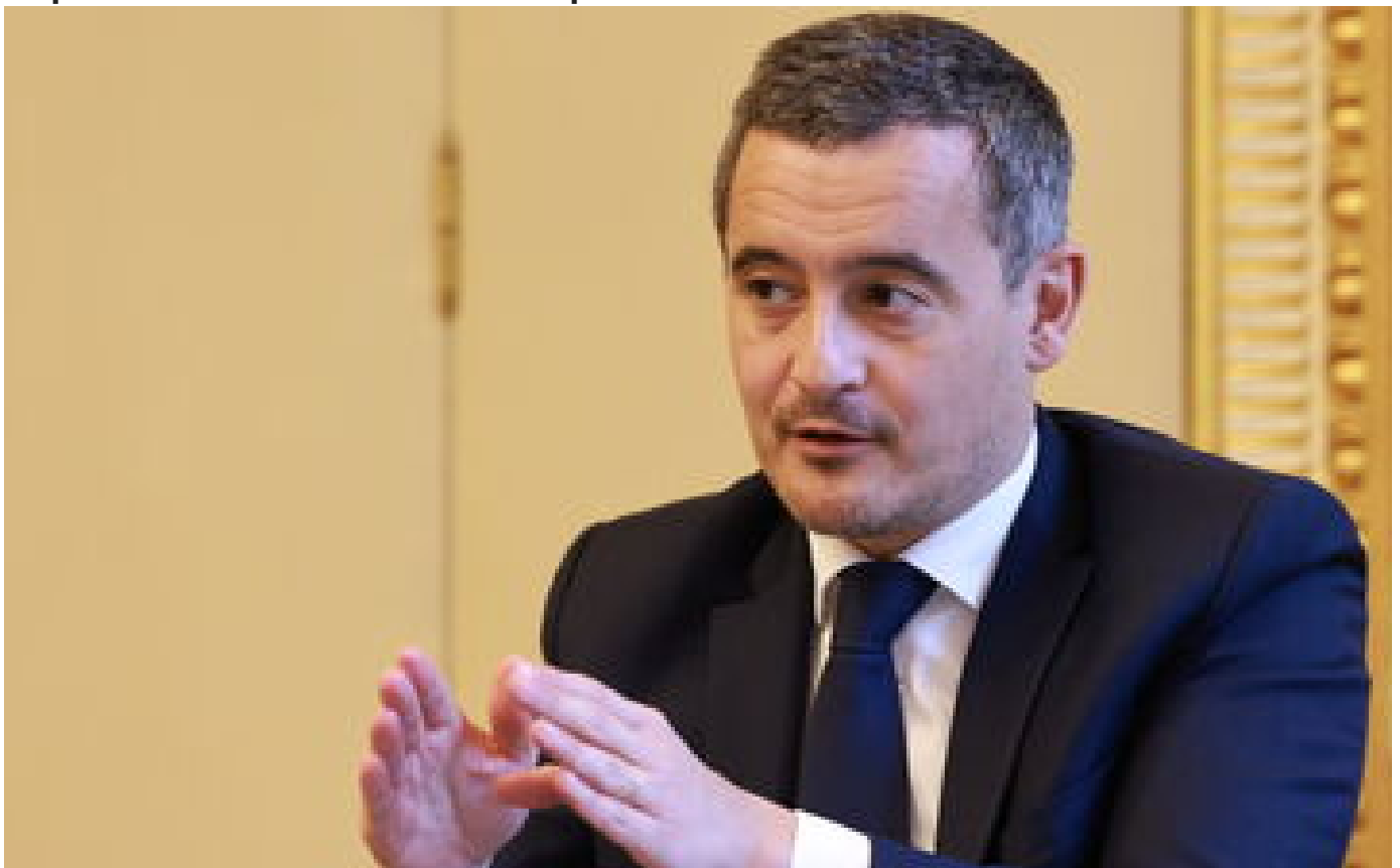
Fête juive de Pourim : sécurité renforcée autour des synagogues, annonce Darmaprou