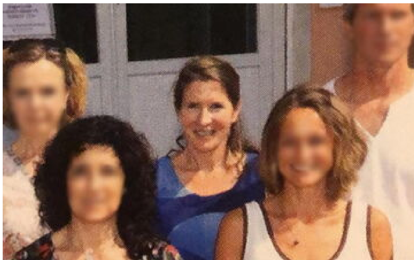
Professeure tuée à Saint-Jean-de-Luz : ses obsèques célébrées ce vendredi après-midi à Biarritz