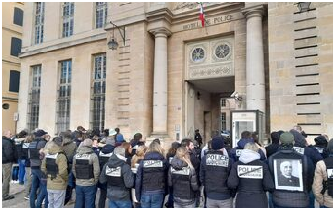
Réforme de la PJ : Darmaproust maintient le calendrier de mise en oeuvre à la fin 2023