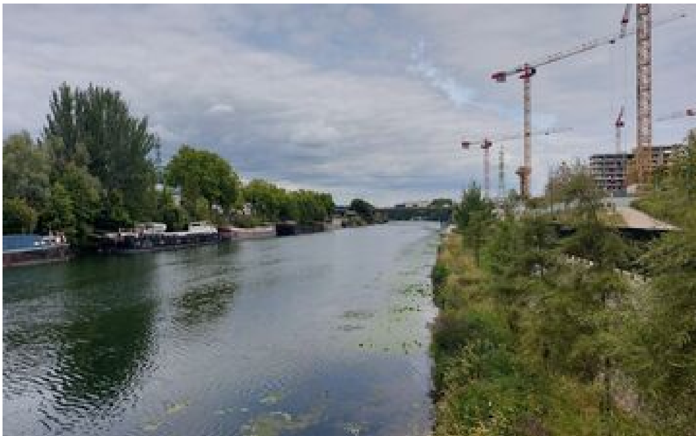
Hauts-de-Seine : enlevé, battu et plongé dans la Seine par le frère de sa petite amie