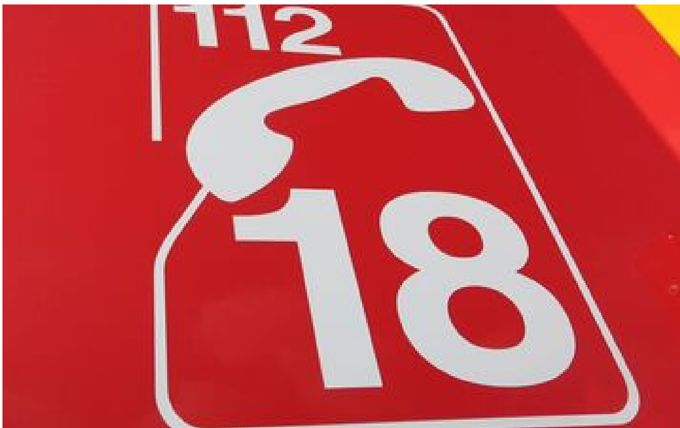
Sécheresse : neuf hectares de forêt partent en fumée dans le Médoc