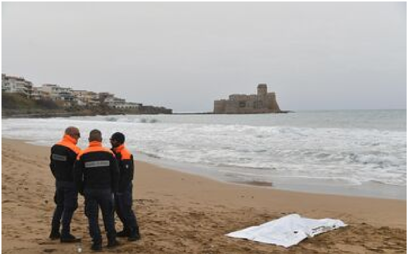
Naufrage d'un bateau de migrants en Italie : le bilan monte à 62 morts