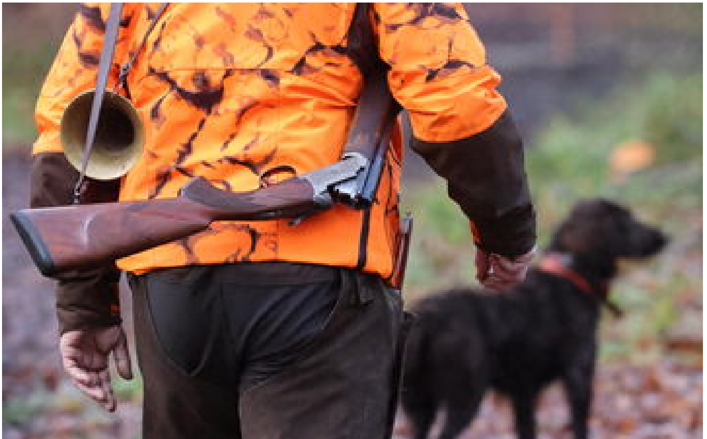
Un chasseur qui en avait tué un autre écope de deux ans de prison avec sursis