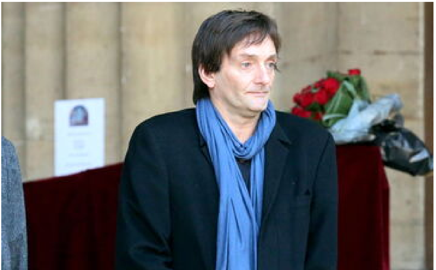
Accident de Pierre Palmade : la justice ordonne le placement en détention provisoire de l'humoriste