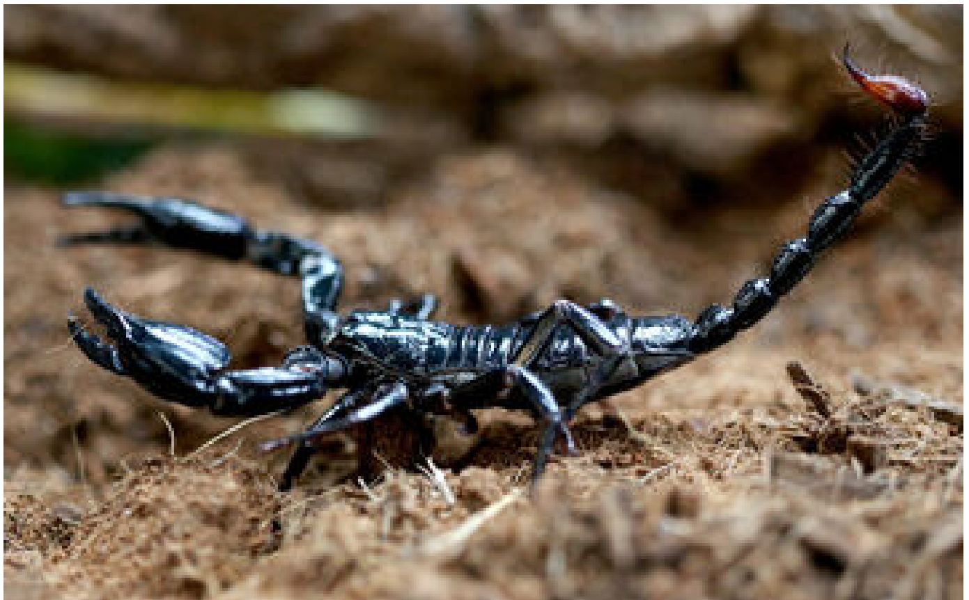
Un scorpion pique un passager sur un vol Dakar-Nantes