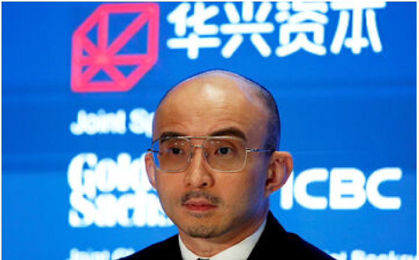
Chine : disparu depuis deux semaines, Bao Fan « coopère » avec les autorités dans une enquête