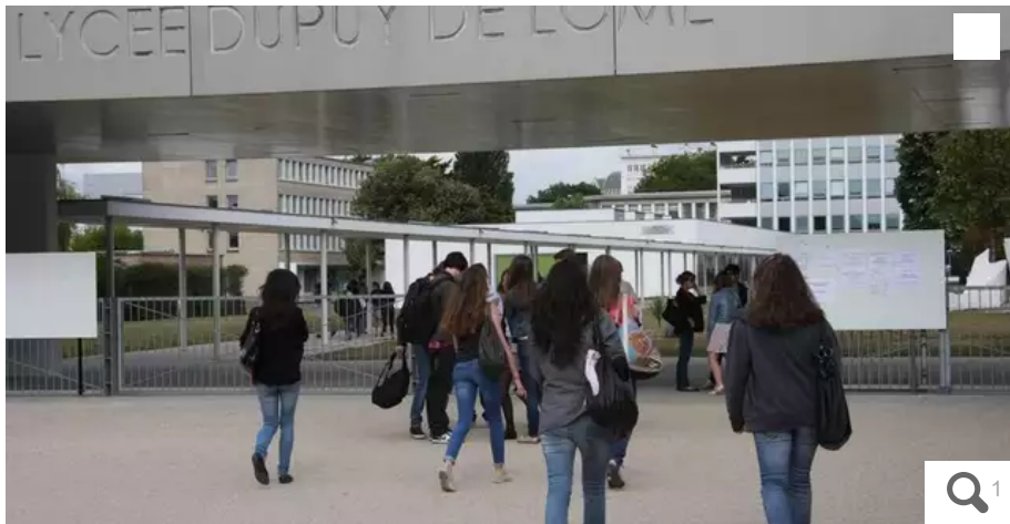
À leur tour, la FCPE et le RN réagissent à l'affaire du tweet diffamatoire au lycée Dupuy-de-Lôme de Lorient.

La fédération de parents FCPE et le Rassemblement national réagissent à la plainte déposée par le proviseur du lycée Dupuy-de-Lôme de Lorient (Morbihan) après le post de tweets jugés « diffamatoires ».