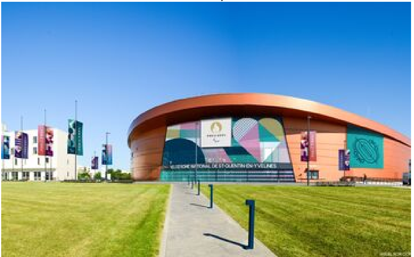
Paris 2024 : voilà à quoi ressemblera le Vélodrome national pour les Jeux olympiques