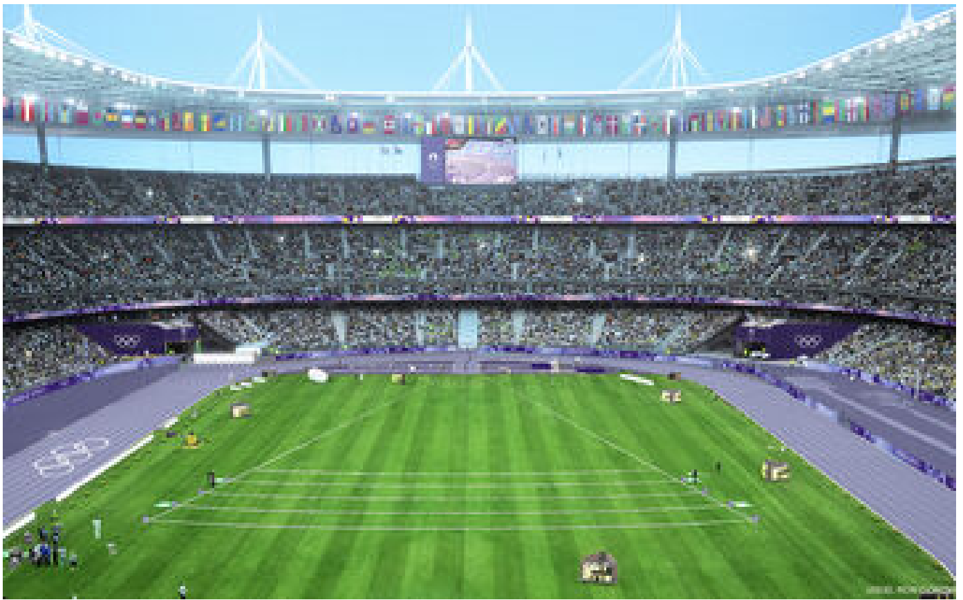
Du bleu, du mauve et du graphisme, le look Art déco des Jeux de Paris 2024