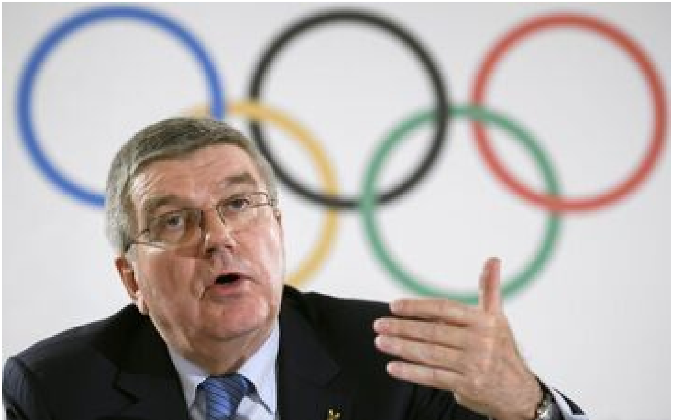
JO 2024 : le CIO dénonce les menaces ukrainiennes de boycott