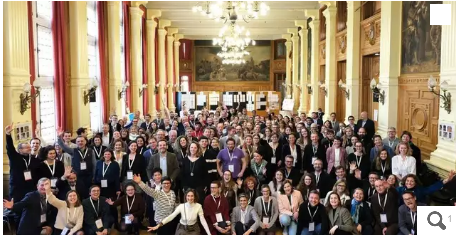
Le Grand défi, un organisme vivant constitué de délégués de cent entreprises tirées au sort, mais aussi d'entreprises marraines, qui financent l'opération. Et de nombreux partenaires, parmi lesquels des syndicats, des organisations étudiantes, écologiques, des collectivités locales. Ici, l'écosystème Grand défi, réuni à Paris jeudi 9 février 2023.

En mode convention climat, le Grand défi des entreprises pour la planète a dévoilé ce jeudi 9 février ses cent propositions pour accélérer la transition écologique de l'économie. Un début, pas une fin.