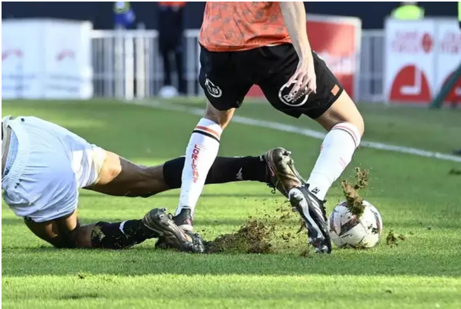
La pelouse du Moustoir est en mauvais état, comme ici dimanche dernier entre Lorient et Angers.

À LIRE ÉGALEMENT. Une nouvelle tribune et un stade plus écologique à Lorient d'ici 2028