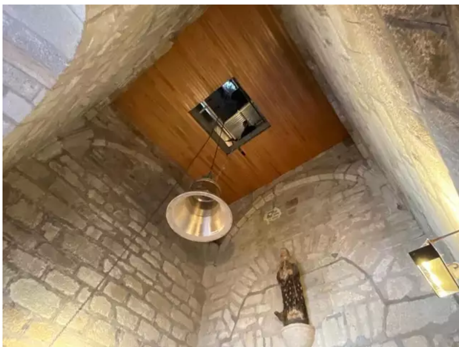
La montée est spectaculaire.

La montée spectaculaire tout comme la descente ont été confiés à Art Camp, une entreprise spécialisée en art campanaire. Dès lundi, les campanistes se sont ainsi attelés aux travaux préparatoires en installant les engins de levage en haut du clocher, en ouvrant le plancher pour libérer l'accès.