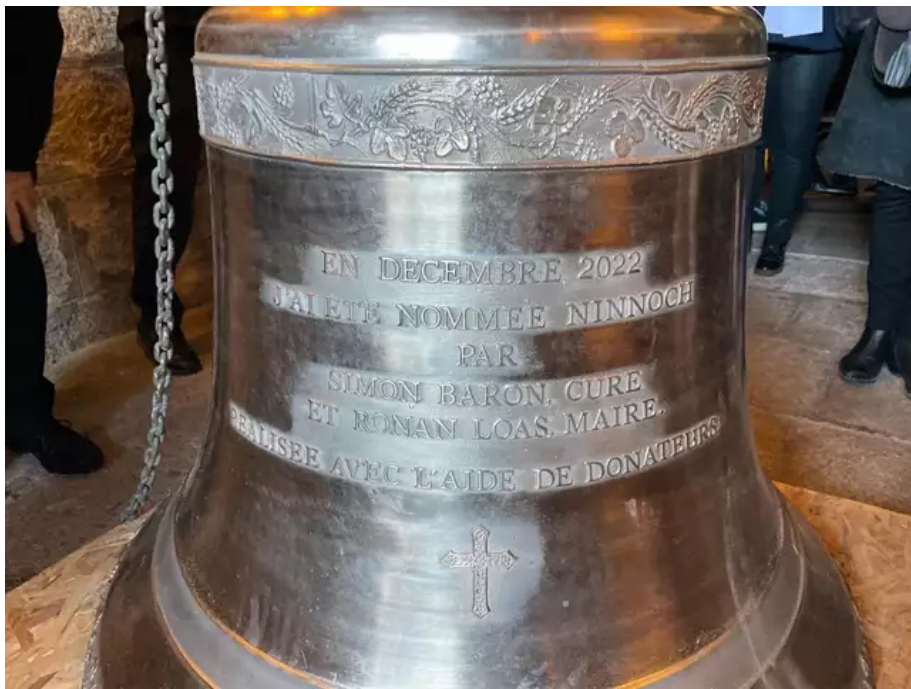
Les noms des parrains de la cloche Ninnoch ont été gravés dessus, Simon Baron, curé et Ronan Loas, maire ainsi que la mention des donateurs qui ont participé partiellement à son financement.

La précédente, qui présentait des signes d'usure après 180 ans de loyaux services, avait été descendue en juin 2020. La municipalité avait alors eu l'idée de faire appel à une souscription populaire via la Fondation du patrimoine pour la remplacer à l'identique. Une cinquantaine de donateurs ont répondu présents permettant de collecter la somme de 6 000 € sur le coût total de 35 600 €.