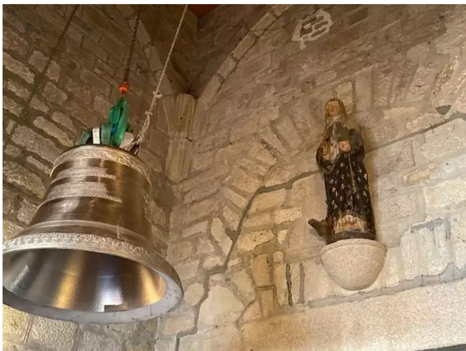
Quand la cloche Ninnoc'h en cours d'ascension rencontre la statue Ninnoc'h qui trône au-dessus du porche de l'église. Ninnoc'h est la sainte patronne de Plœmeur.