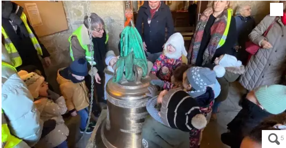
Plusieurs classes des écoles du Sacré-Cœur et Notre-Dame de la Garde ont fait le déplacement pour venir voir de près la nouvelle cloche. Les enfants ont été impressionnés et n'ont pas manqué de la toucher.

Livrée le 23 décembre 2023 et baptisée le dimanche 5 février 2023, la cloche Ninnoc'h a pu être hissée, ce mardi 7 février, en haut du clocher pour rejoindre les trois autres cloches de l'église Saint-Pierre.