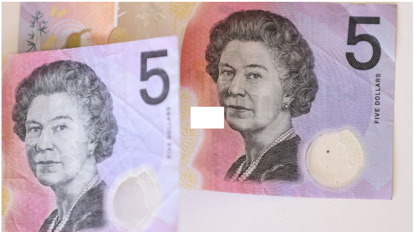
L'effigie des souverains britanniques va disparaître des billets de banque en Australie / Le 12h30 / 1 min. / aujourd'hui à 12:40

Le portrait d'Elizabeth II sera remplacé sur les nouvelles coupures de cinq dollars par un motif honorant la culture autochtone, a annoncé jeudi la banque centrale australienne.