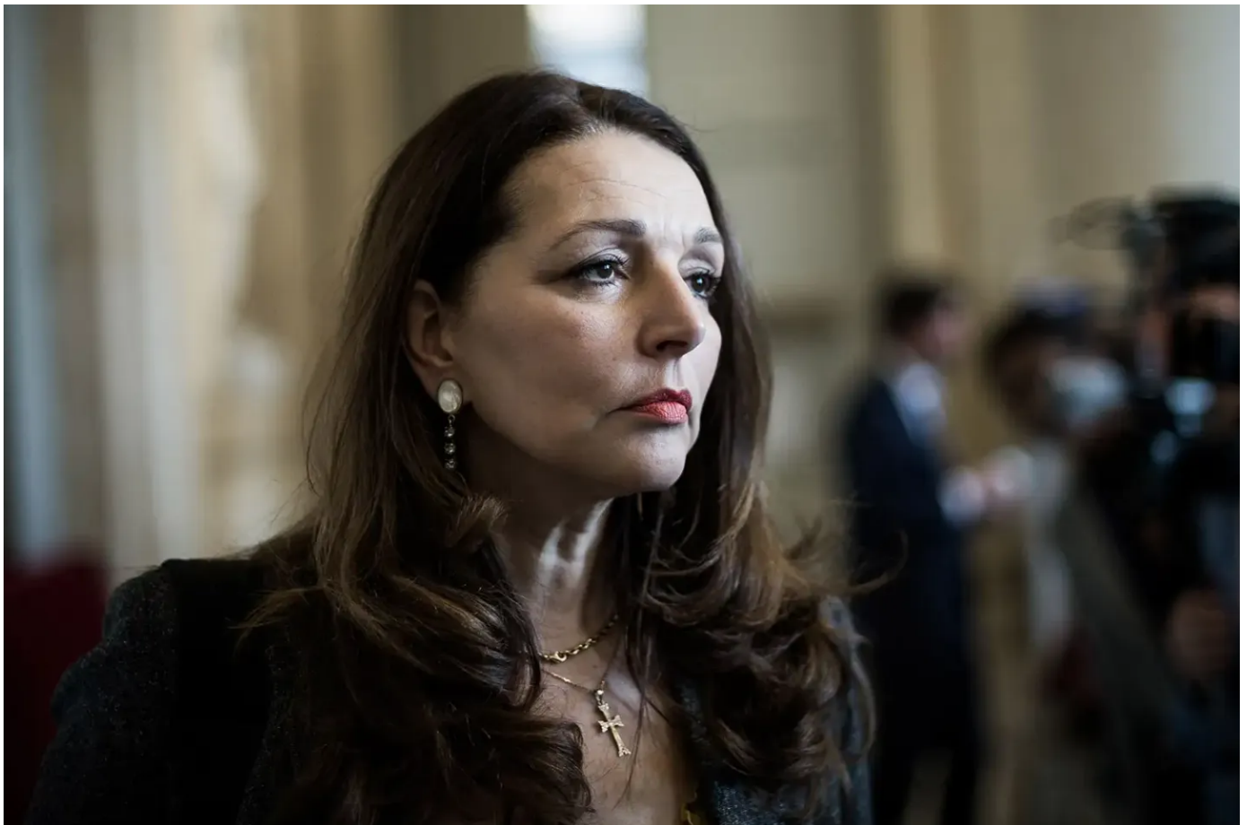
Valérie Boyer, députée LR des Bouches-du-Rhône.

15/07/2019 à 11:00, Mis à jour le 30/01/2023 à 09:12