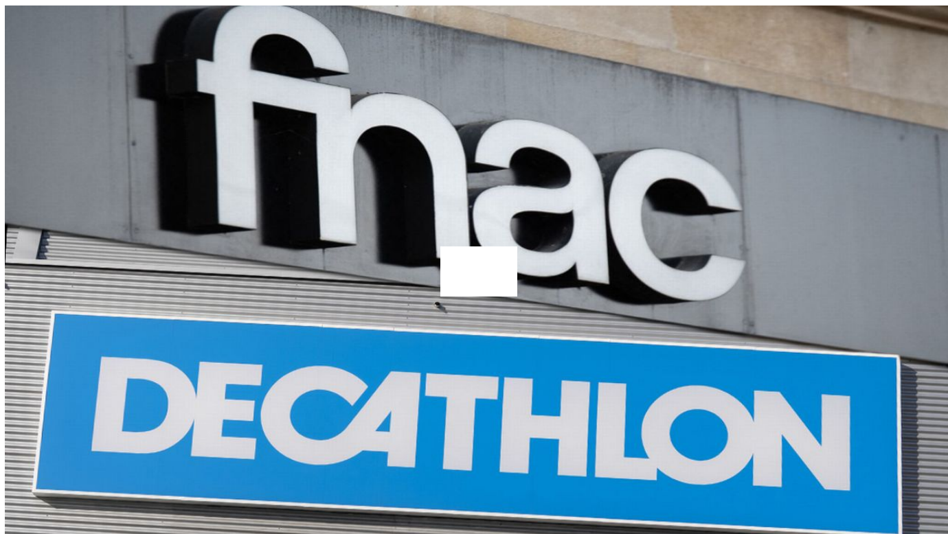
Fnac Suisse et Decathlon ferment plusieurs points de vente en Suisse / Le Journal horaire / 31 sec. / aujourd'hui à 20:02

Le distributeur français Fnac va fermer la quasi-totalité de ses points de vente établis dans les grands magasins Manor en Suisse alémanique. Dix boutiques et environ 60 personnes seront touchées par la mesure. Trois magasins du même type de Decathlon cesseront aussi leur activité, dont un à Fribourg.