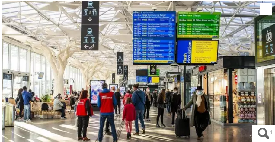
De nouveaux trains privés pourraient arriver en gare de Nantes à l'horizon 2025.

La compagnie privée française Le Train a annoncé, lundi 23 janvier, la commande de dix trains à grande vitesse au constructeur ferroviaire espagnol Talgo, pour environ 300 millions d'euros, avec l'objectif de les lancer sur les rails en France en 2025.