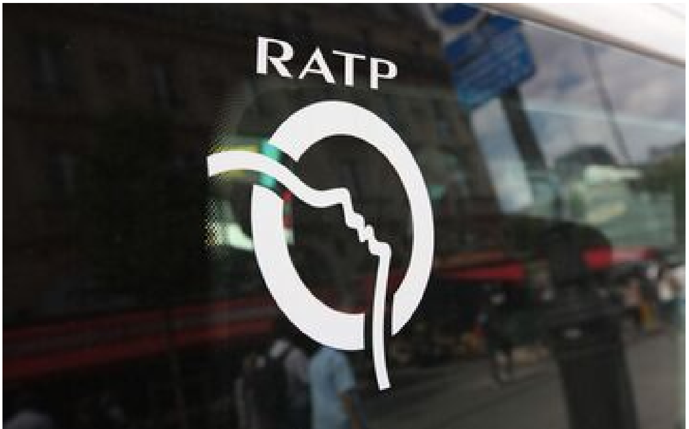
RATP : trois syndicats acceptent la proposition d'augmentation de salaires de la direction