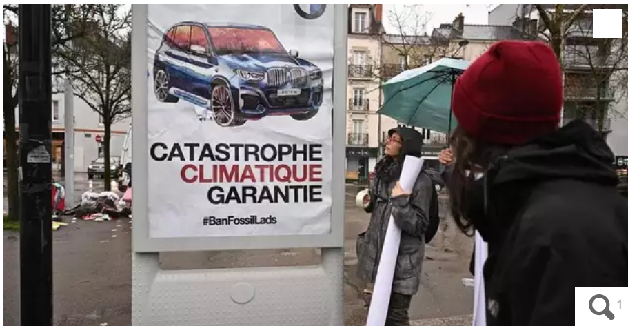
Une affiche publicitaire détournée, pour un SUV, posée à Nantes, samedi.

La méthode s'appelle le « brandalisme » : 400 publicités pour des marques automobiles ont été détournées dans quatorze villes d'Europe.