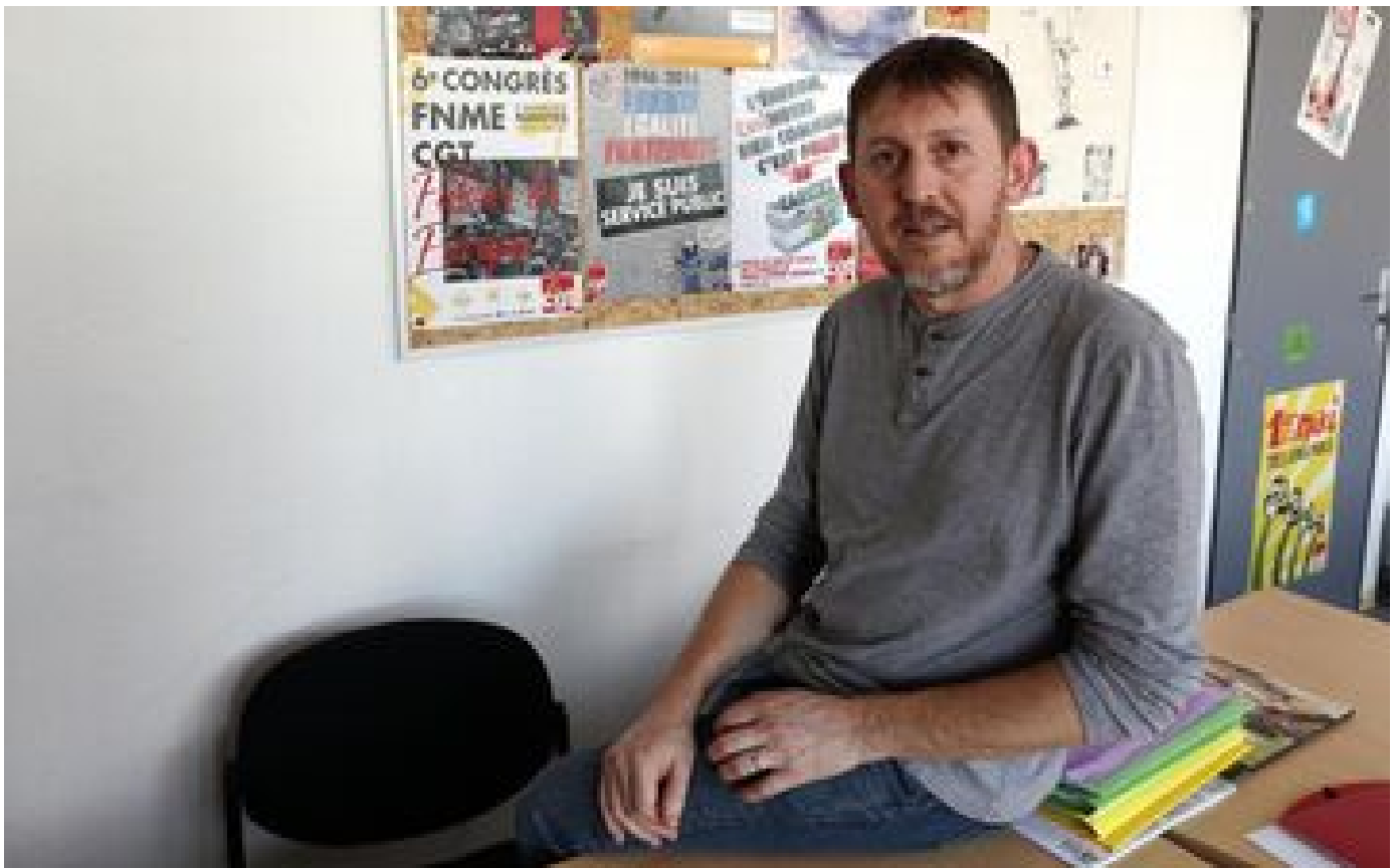
Retraites : la CGT énergie menace de «s'occuper» des élus partisans de la réforme