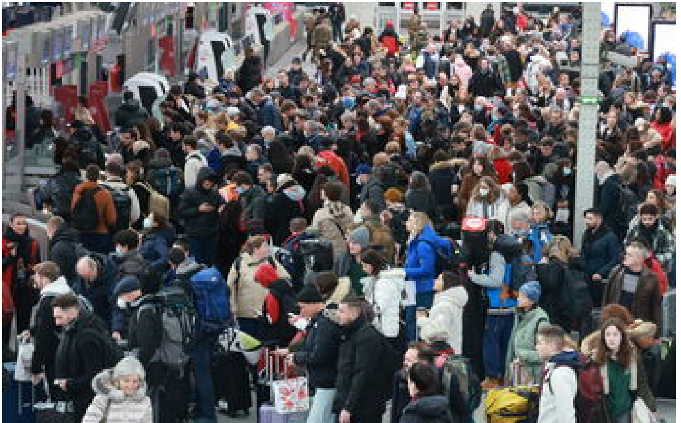
Grève du 19 janvier : SNCF, RATP, raffineries, écoles, aérien... les perturbations secteur par secteur