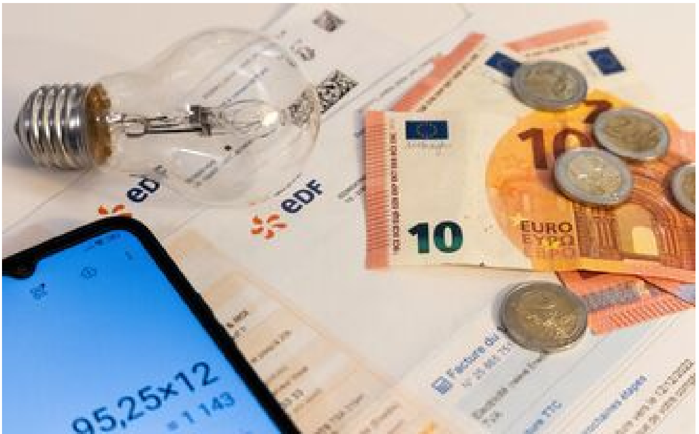
Prix de l'énergie : un peu moins de 500 entreprises ont bénéficié des aides au guichet