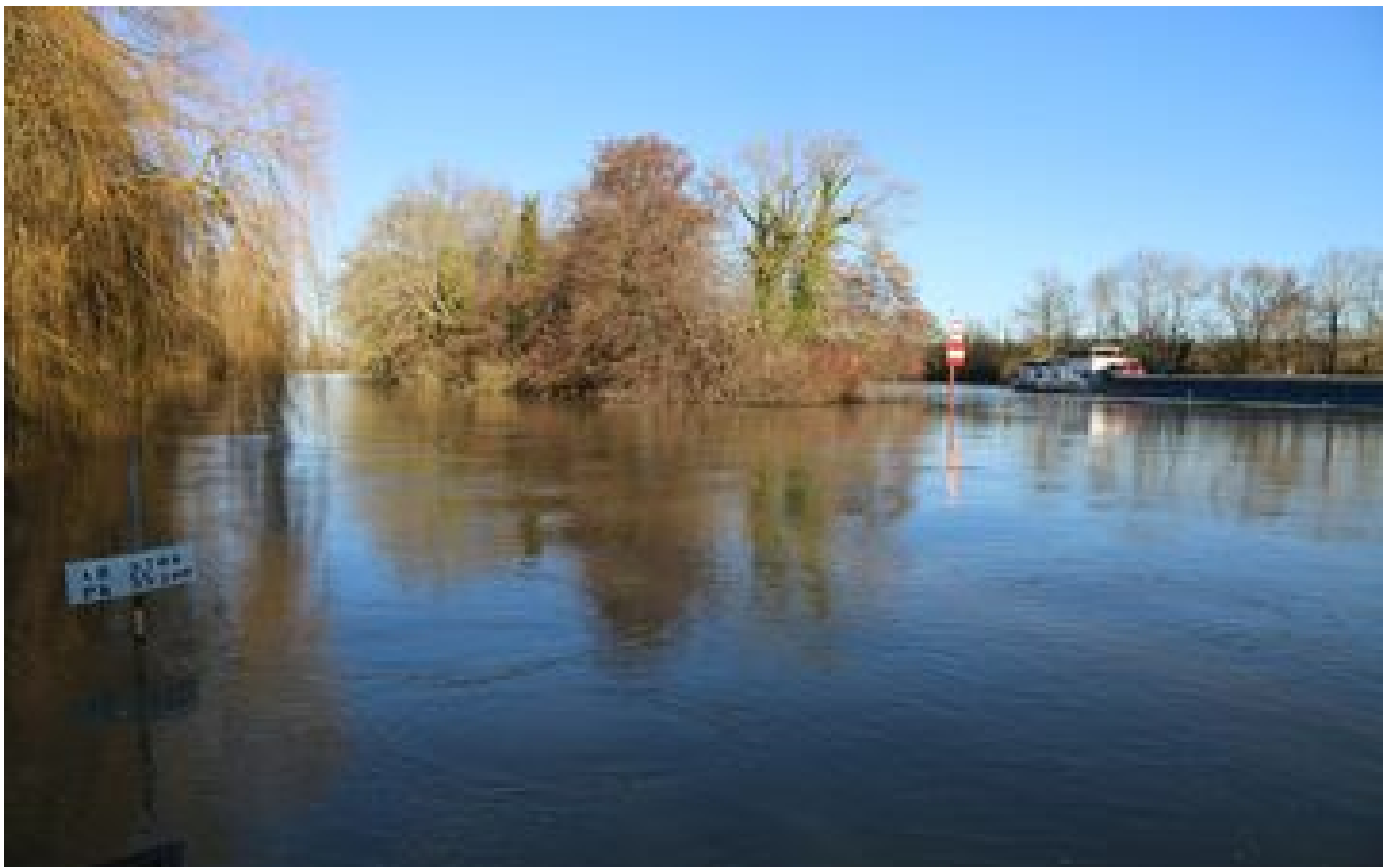
Le canal Seine-Nord Europe a besoin de bras : 6000 emplois à la clé pour un chantier «historique»