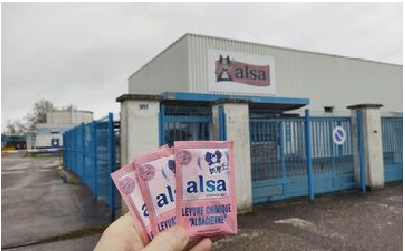
Levures Alsa : presque toute la production sera rassemblée à Strasbourg