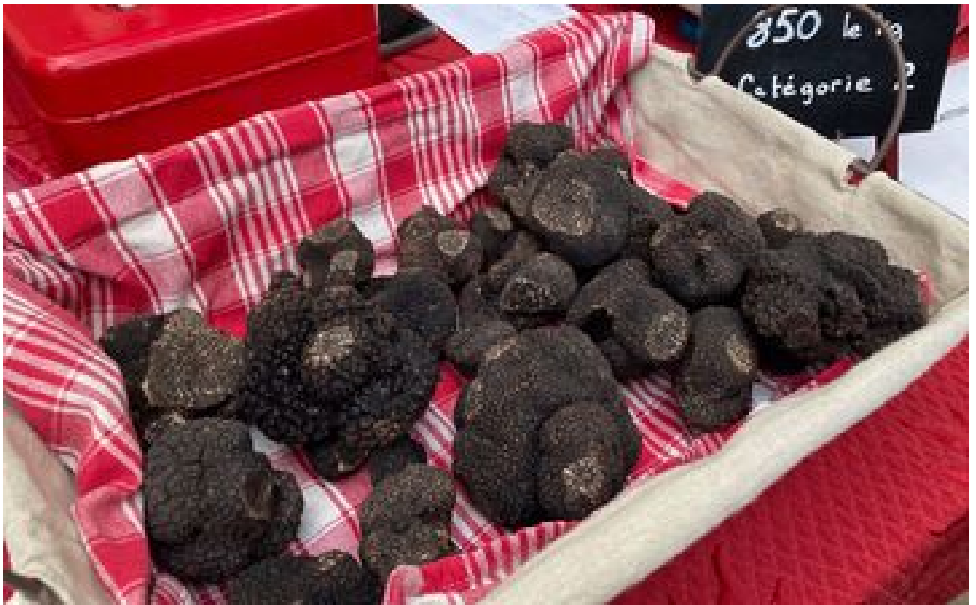
La truffe s'enracine au cœur des terres de Beauce