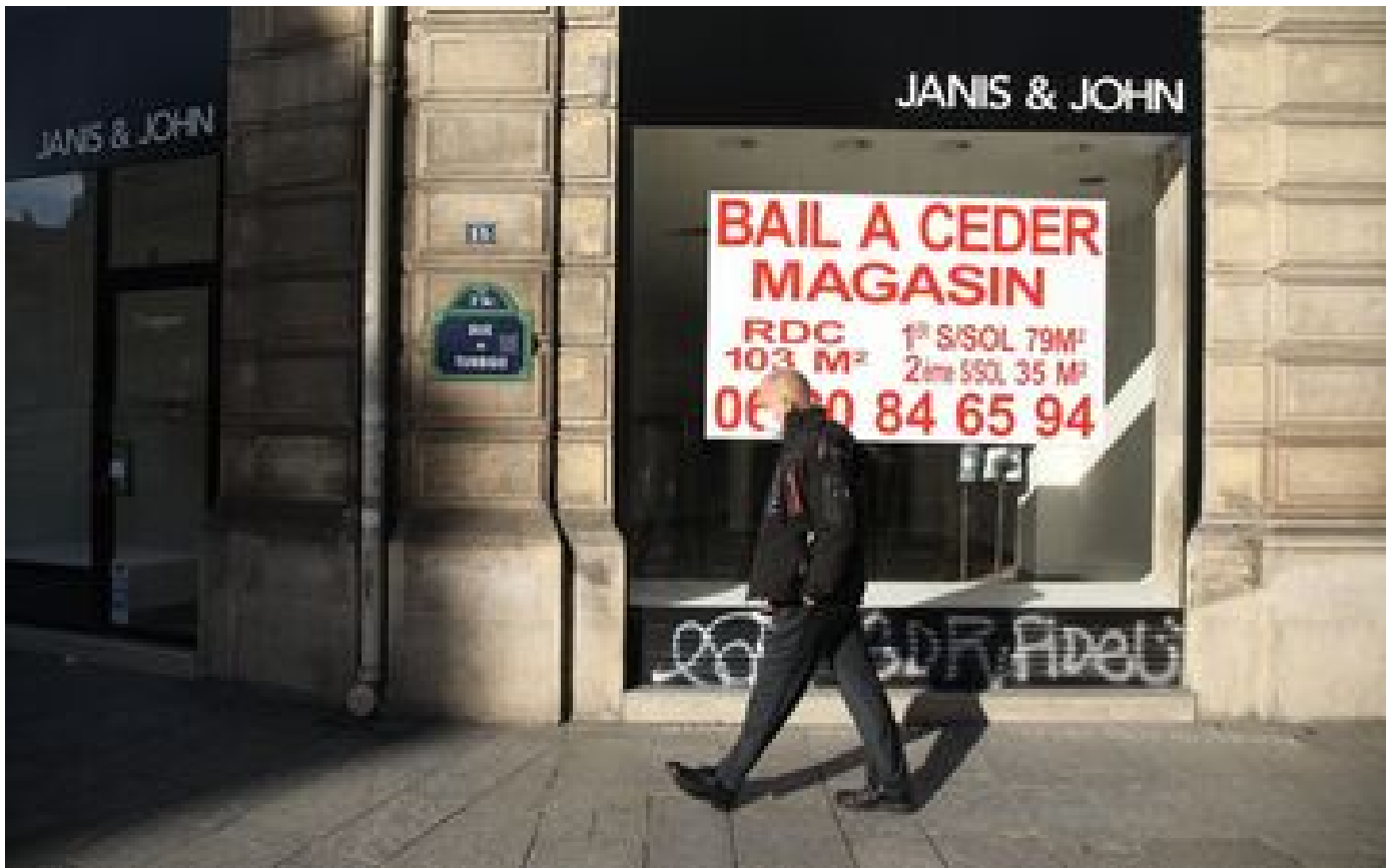
Les défaillances d'entreprises en forte hausse fin 2022