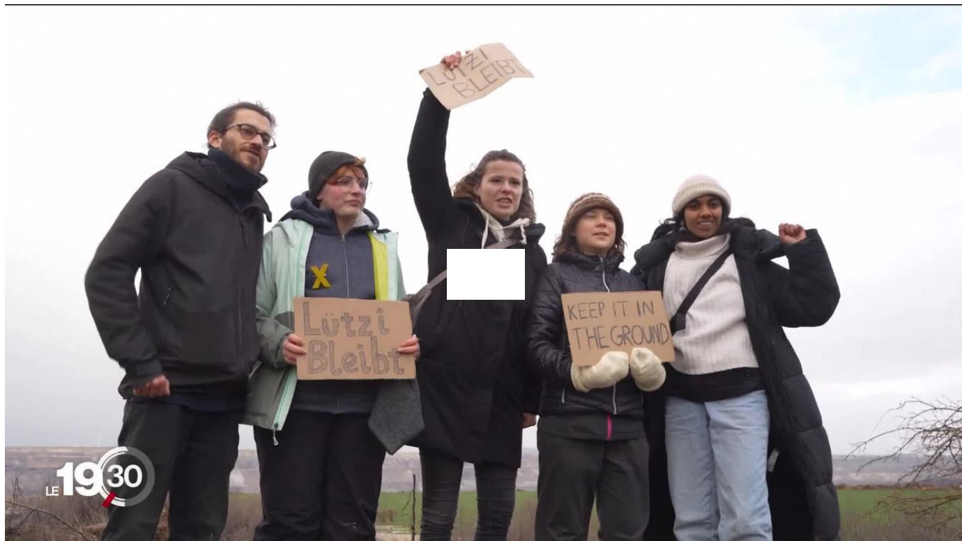
En Allemagne, les défenseurs pour le climat retranchés près de la mine de charbon de Lützerath sont soutenus par Greta Thunberg / 19h30 / 1 min. / hier à 19:30

Environ 6000 manifestants - dont la militante écologiste suédoise Greta Thunberg - ont marché samedi jusqu'au village de Lützerath dans l'ouest de l'Allemagne, selon les estimations de la police, pour protester contre l'extension d'une mine de charbon à ciel ouvert.