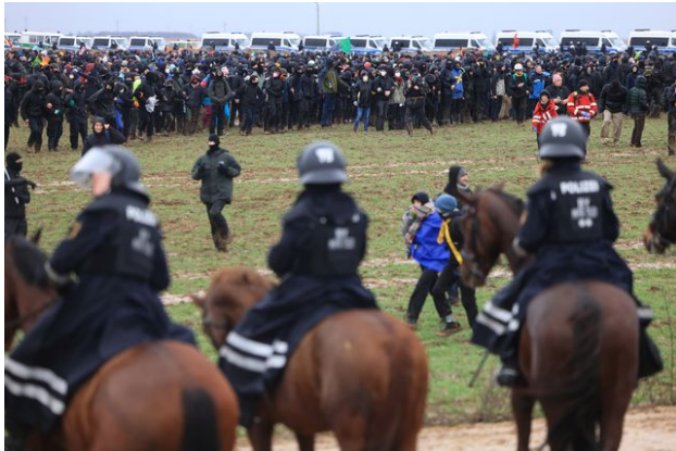
La police empêche les manifestants d'entrer dans la zone de Lützerath.

Un peu plus tôt, des journalistes de l'AFP avaient assisté à des échauffourées entre des groupes de manifestants et la police, visée par des tirs d'engins pyrotechniques. Des médias faisaient état de jets de pierres.