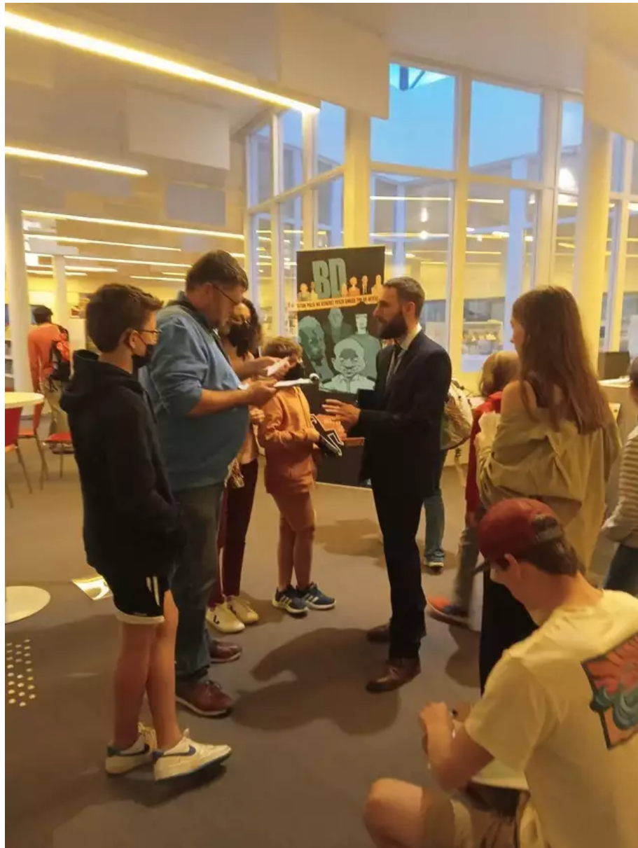
Lors de la première Murder Party, à Passe Ouest.

Le Centre national du livre, sur proposition du ministère de la Culture, organise pour la deuxième année consécutive Les Nuits de la lecture, un peu partout en France, du 19 au 22 janvier, sur le thème de la peur.