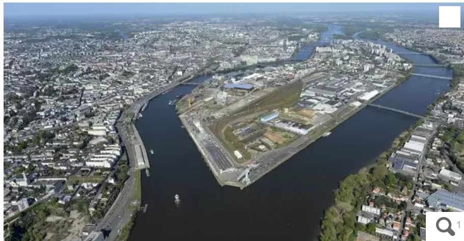
En Loire-Atlantique, le rythme d'artificialisation des terres a ralenti sur les dix dernières années.

Zan, pour Zéro artificialisation nette : ces trois petites lettres font frémir nombre d'élus. Mais de quoi parle-t-on au juste ? Les rédactions de Ouest-France en Loire-Atlantique proposent une série d'articles pour expliquer l'impact de cette loi qui impose de diviser par deux le rythme d'artificialisation des sols d'ici à 2030.