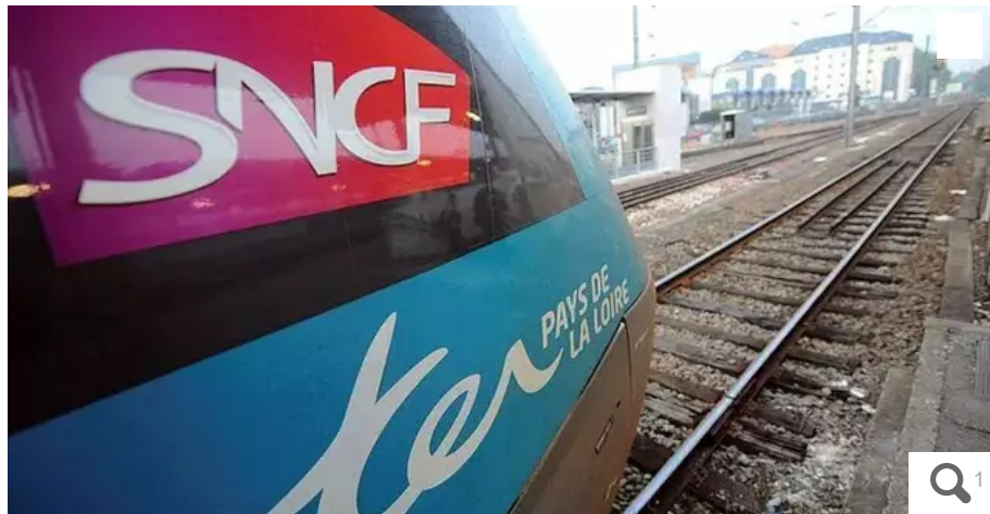
Une grève des cheminots aiguilleurs du Mans affecte le trafic des TER dans l'Ouest de la France, dimanche 1er et lundi 2 janvier 2023.

Le trafic ferroviaire des TER est toujours perturbé ce lundi 2 janvier 2023 dans l'Ouest de la France, en raison d'un mouvement social des aiguilleurs SNCF du Mans. Cinq lignes sont touchées. Les cheminots-aiguilleurs protestent contre la délocalisation du poste d'aiguillage du Mans à Rennes, qui entraînerait, selon eux, la suppression d'une centaine d'emplois en Sarthe et dans la Mayenne.