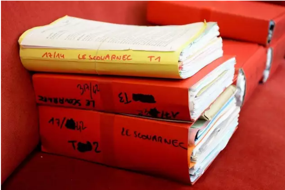
Le premier procès de Joël Le Scouarnec avait eu lieu au palais de justice de Saintes.

Détenu au centre pénitentiaire de Plœmeur, il pourrait être jugé au mieux en fin d'année. Le procès, qui n'est pas encore audiencé, durera plusieurs mois dans une salle qui pourra accueillir un millier de personnes.