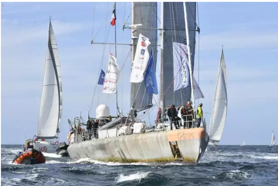
Le retour de la goélette « Tara » après sa dernière expédition autour du monde, en octobre 2022.

Accueillie par plus de 5 000 personnes pour le retour de sa dernière expédition, en octobre 2022 , la goélette Tara repartira en fanfare, le 2 avril, pour une nouvelle mission de deux ans en mer Baltique et en Méditerranée.