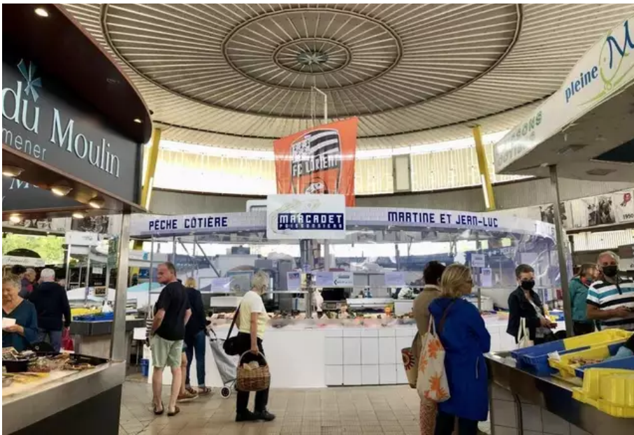
Les halles de Merville conserveront leur forme originale, bien singulière avec sa coupole.