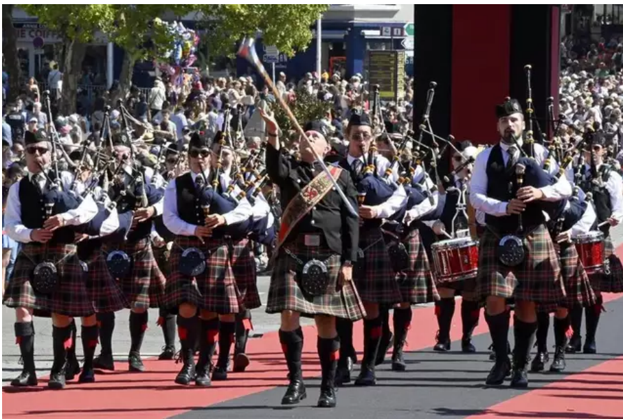
Un pipe band lors de la Grande parade en août 2022.

L'Irlande, à l'honneur de la 52 e édition du Fil