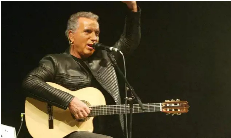
Ce sera la seule scène de Bernard Lavilliers dans la région l'été 2023.

La deuxième édition du festival Lorient Océans se déroulera du 29 juin au 2 juillet 2023. Quatre jours de fête sur terre et sur mer pour célébrer les six ports de Lorient. Bernard Lavilliers et Claudio Capéo seront les têtes d'affiche du festival, le 1er juillet , sur l'aire de réparation navale du port de pêche, au milieu des bateaux mis au sec. Également à l'affiche, les chanteuses Corine et Aurélia.