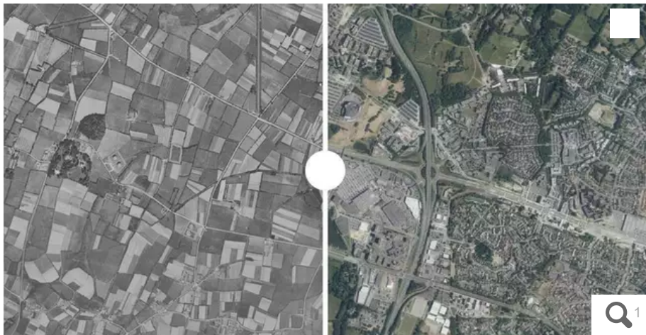
Saint-Herblain, Atlantis avant/après.

Vu du ciel, la différence est frappante. En 70 ans, plus de 70 000 ha d'espaces naturels ont disparu sous les constructions humaines en Loire-Atlantique.