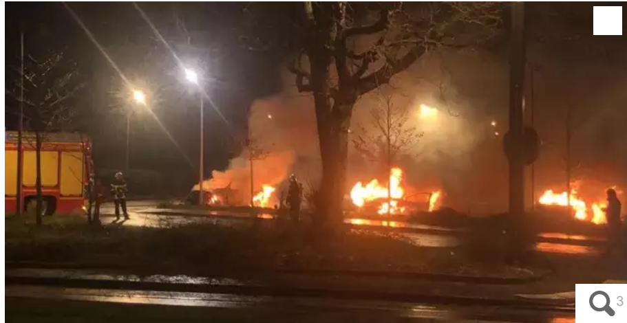
Trois voitures en feu vers 23 h près du Sillon de Bretagne, à Saint-Herblain. Policiers et pompiers ont été accueillis par quelques tirs de mortiers, en l'air.

Votre e-mail, avec votre consentement, est utilisé par la société Ouest-France Multimédia pour recevoir les newsletters sélectionnées. En savoir plus