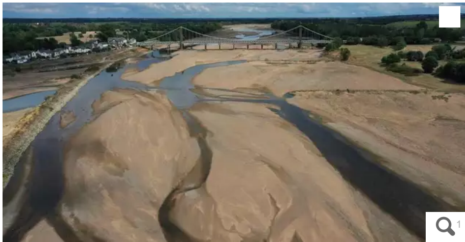
Avec la sécheresse, le niveau de la Loire était au plus bas au mois d'août sous le pont qui relie Varades en Loire-Atlantique et Saint-Florent-le-Vieil dans le Maine-et-Loire.

L'année 2022 est marquée par des records de températures sans précédents depuis les premiers relevés de Météo France en 1946. Bilan en Loire-Atlantique.