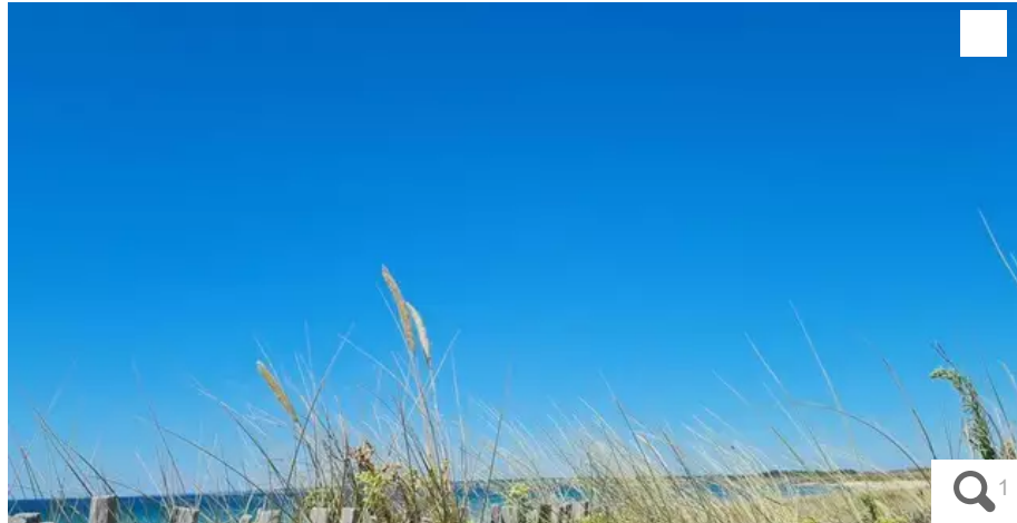
L'année 2022 a été marquée par une longue sécheresse, canicules et forts contrastes.

Votre e-mail, avec votre consentement, est utilisé par la société Ouest-France Multimédia pour recevoir les newsletters sélectionnées. En savoir plus