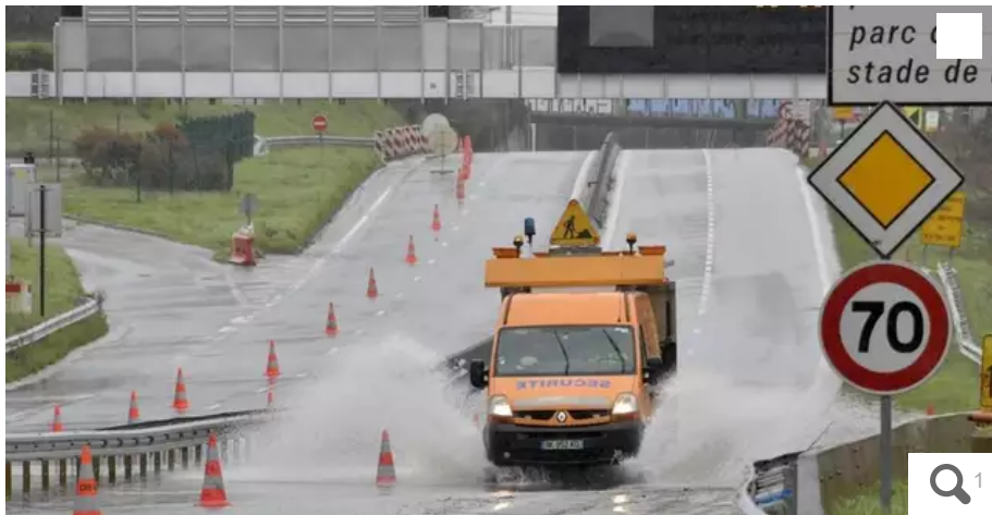
Après les inondations, le périphérique nantais est coupé de la porte d'Anjou vers la porte d'Orvault.

Les fortes pluies de ces derniers jours ont fait monter le niveau du Gesvres, ce qui a provoqué l'inondation d'une partie du périphérique nantais, en pleine nuit du vendredi 23 au samedi 24 décembre.