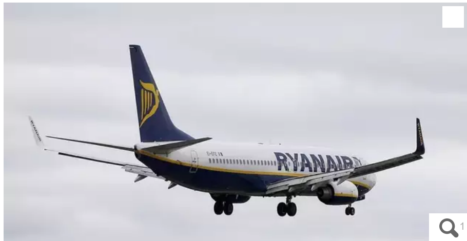
L'avion, qui a décollé de Dublin à 19 h 05, heure locale, pour Nantes, est revenu à son point de départ en pleine nuit, en dépit de deux tentatives d'atterrissage à l'aéroport nantais. Et d'un détour par Tours et Marseille.

L'avion, qui a décollé de Dublin jeudi 22 décembre au soir, est revenu à son point de départ vers 3 h du matin, le lendemain... en passant par Tours et Marseille, sans avoir pu se poser à l'aéroport Nantes-Atlantique, en dépit de deux tentatives.