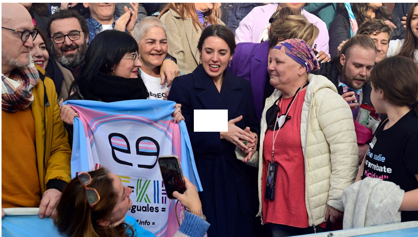
En Espagne, les députés adoptent une "loi transgenre" qui divise la gauche et l / Le Journal horaire / 20 sec. / aujourd'hui à 17:04

Les députés espagnols ont adopté jeudi un projet de loi permettant de changer librement de genre à l'état civil dès 16 ans. Ce vote fait suite à des mois de tensions au sein de la gauche et des mouvements féministes. Le même jour, un texte similaire a été adopté en Ecosse.