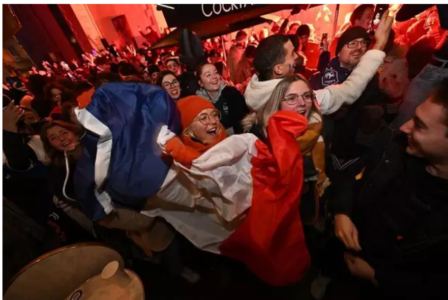
À chaque but, les supporters exultent.

Après la reprise, les Bleus ont réveillé la torpeur des supporters avec deux buts de Kylian Mbappé, qui égalise avec l'Argentine.