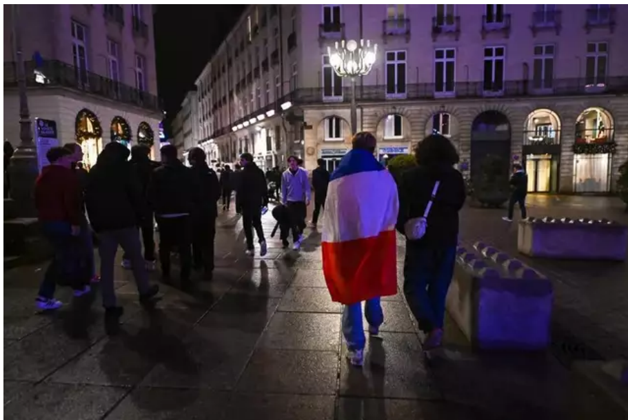
La défaite est amère dans les rues de Nantes.

Entre espoir et déception, les supporters ont tenu le coup. Jusqu'aux tirs au but, ils ont espéré et cru en la victoire des Bleus ( défaite 3-3 ; 4-2 aux tirs au but).