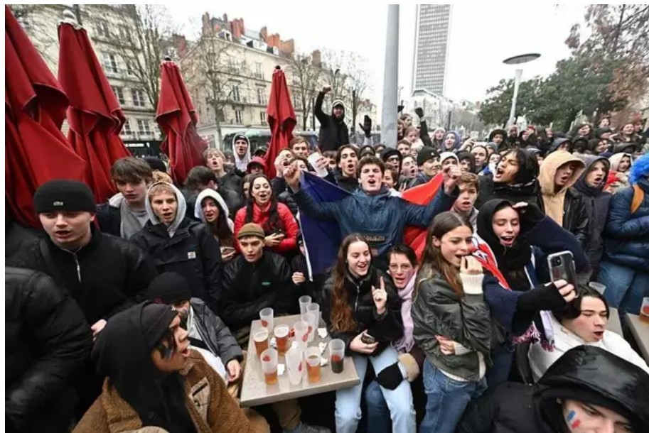
Avant le début du match, les supporters sirotaient des bières et mettent l'ambiance.

Les Nantais étaient nombreux, parés de bleu blanc rouge, à affluer dans les rues de Nantes pour voir la finale de la Coupe du monde. La France affrontait l'Argentine au Qatar ce dimanche 18 décembre.