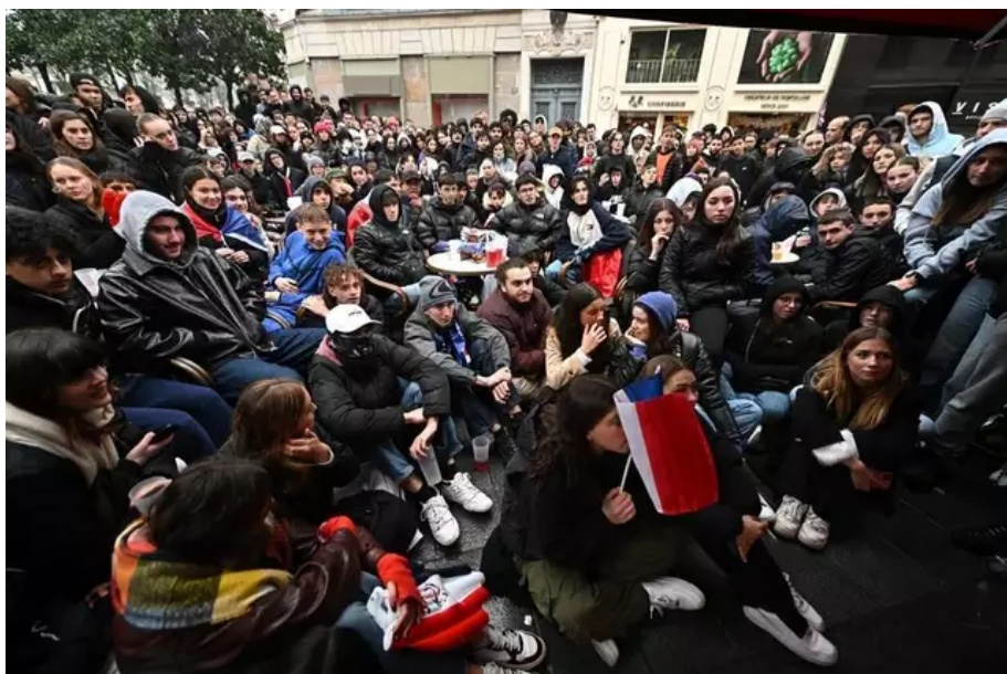
Les supporters se serrent pour mieux voir, et aussi se tenir chaud !

Et il fallait jouer des coudes pour se faire une place dans les bars bondés.