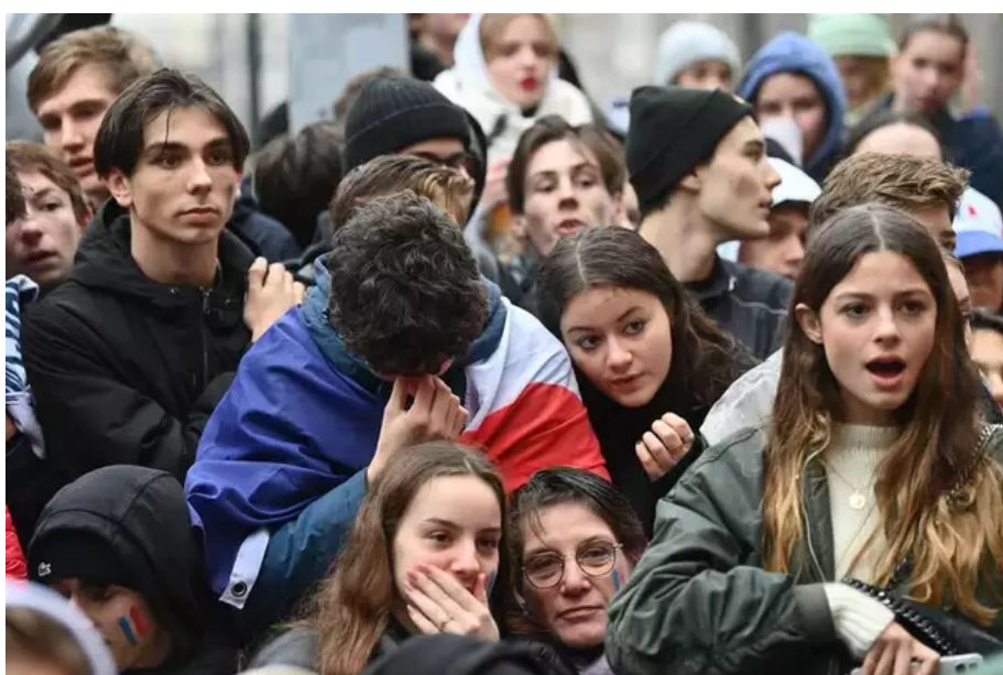
De nombreux supporters étaient dépités par le résultat du match.

Les deux buts de l'Argentine en première mi-temps ont d'abord bien refroidi les Nantais, supporters des Bleus.