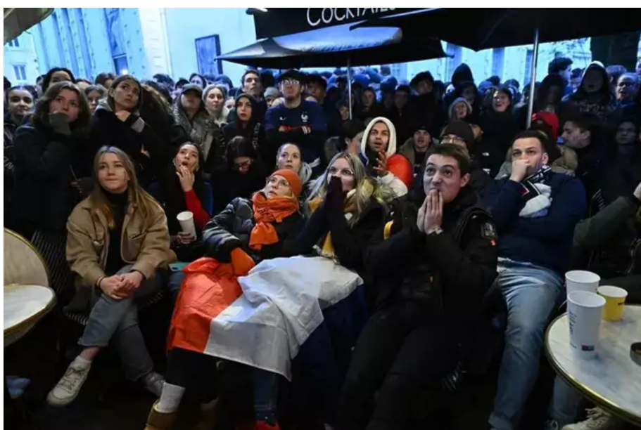
Les supporters nantais sont passés par toutes les émotions au cours du match.

Des fumigènes sont craqués, un peu partout, la soirée prend une nouvelle tournure.