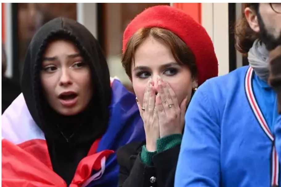
L'émotion était grande dans les rangs des supporters nantais.

Les deux buts de l'Argentine en première mi-temps ont d'abord bien refroidi les Nantais, supporters des Bleus.