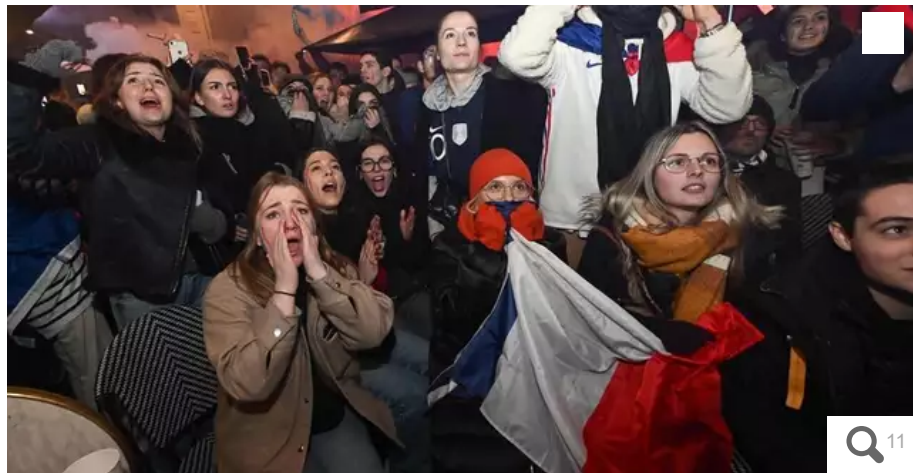
Les supporters Nantais étaient nombreux à assister à la finale de la Coupe du monde entre la France et l'Argentine.

Les supporters se sont précipités au chaud, dans les bars à Nantes, pour regarder le match de Coupe du monde France-Argentine, ce dimanche 18 décembre. Nos journalistes sur le terrain ont immortalisé cette finale depuis les rues et les bars de Nantes.