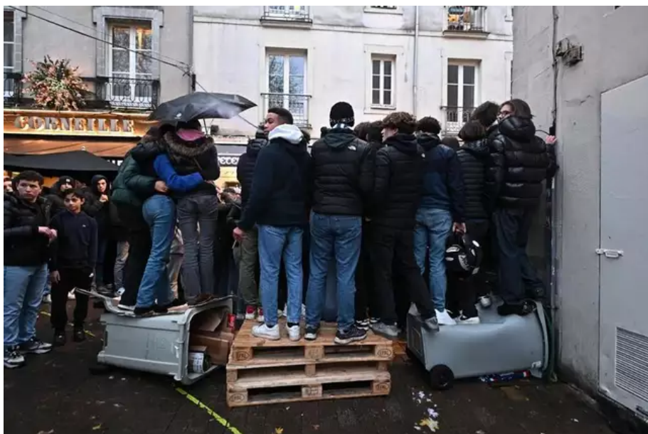
Ils étaient prêts à tout pour voir l'écran, comme ici, perchés sur des poubelles.