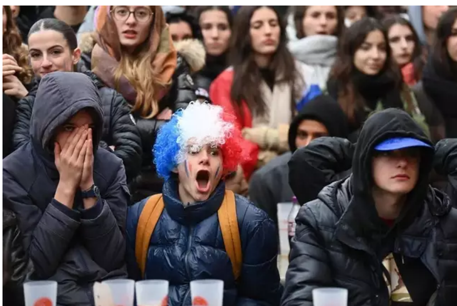
Le match, entre instants de liesse et déception, a stressé de nombreux jeunes spectateurs.

Et il fallait jouer des coudes pour se faire une place dans les bars bondés.