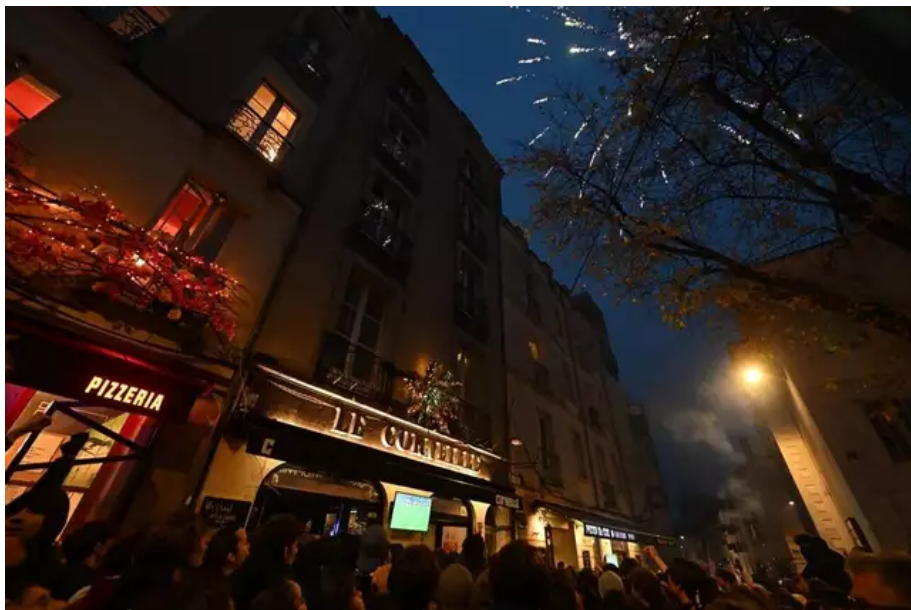
Des feux d'artifice ont été tirés dans les rues de Nantes, quand la France a égalisé.

Entre espoir et déception, les supporters ont tenu le coup. Jusqu'aux tirs au but, ils ont espéré et cru en la victoire des Bleus ( défaite 3-3 ; 4-2 aux tirs au but).