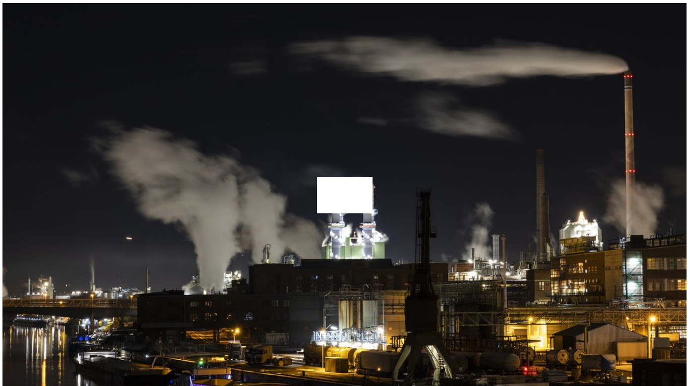
L'Union européenne réforme son marché du carbone / Le 12h30 / 1 min. / aujourd'hui à 12:36

Fin des "droits à polluer" gratuits des industriels, taxation des émissions liées au chauffage et aux voitures ou encore fonds social pour la transition. L'UE a trouvé un accord dimanche sur une vaste réforme de son marché carbone, pièce maîtresse du plan climat européen.