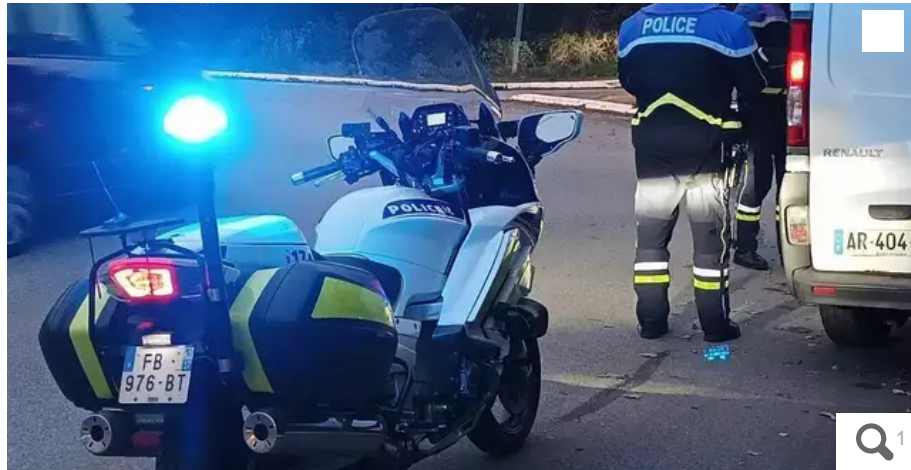
Treize motards CRS et une quinzaine de policiers ont été mobilisés pour des opérations anti-cambriolages.

Des motards CRS sont venus prêter main-forte aux policiers de l'agglomération de Lorient (Morbihan) pour effectuer des opérations de lutte contre les cambriolages. Jeudi 15 décembre 2022, des contrôles ont été effectués à Larmor-Plage et Plœmeur.