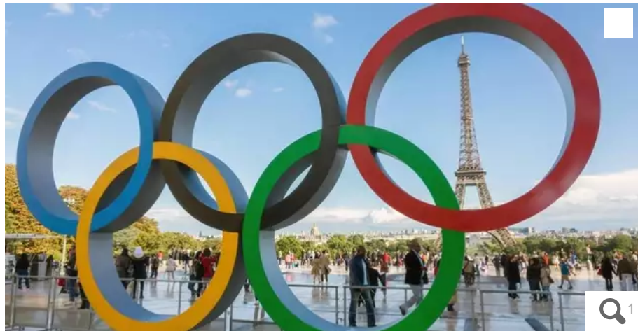
Malgré les Jeux olympiques de Paris en 2024, la majorité des festivals auront tout de même lieu, en France, cette année-là.

Les festivals d'Avignon, des Vieilles Charrues ou l'Interceltique de Lorient auront bien lieu à l'été 2024, moyennant un ajustement de leurs dates pour ne pas tomber en même temps que les Jeux olympiques, a annoncé mardi le ministère de la Culture.