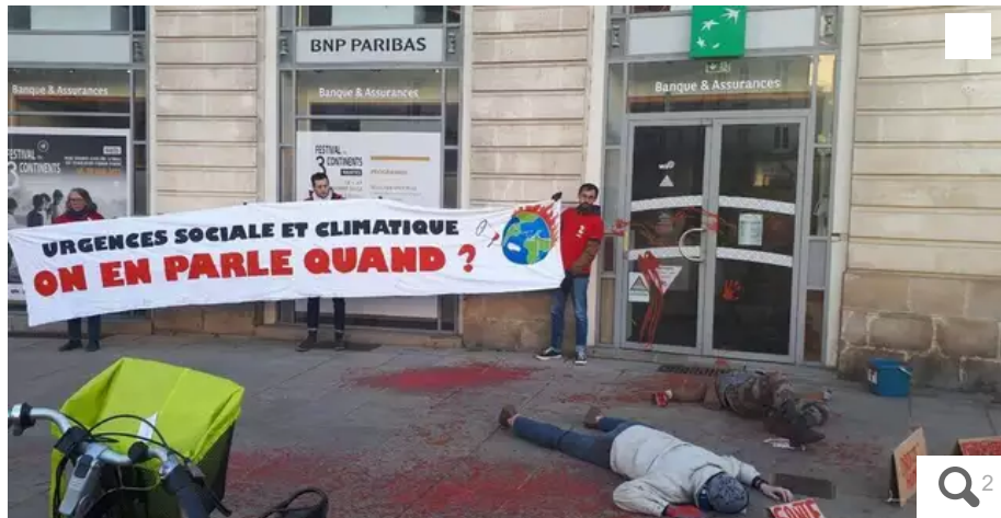
Une vingtaine de militants ont simulé une scène de crime médiatique ce samedi 10 décembre, dans le centre-ville de Nantes.

Des militants ont simulé, ce samedi 10 décembre, une scène de « crime climatique », devant la BNP Paribas, place Graslin, à Nantes.