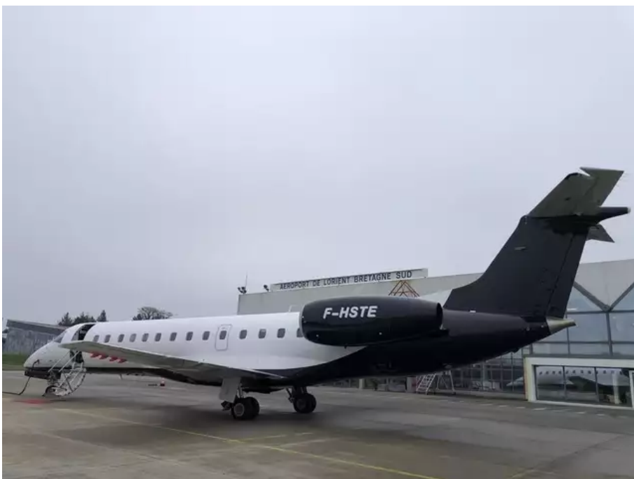
D'ici avril 2023, deux avions seront basés à l'aéroport de Lorient Bretagne-Sud. Le premier doit débiter ses rotations dès le mois de janvier.