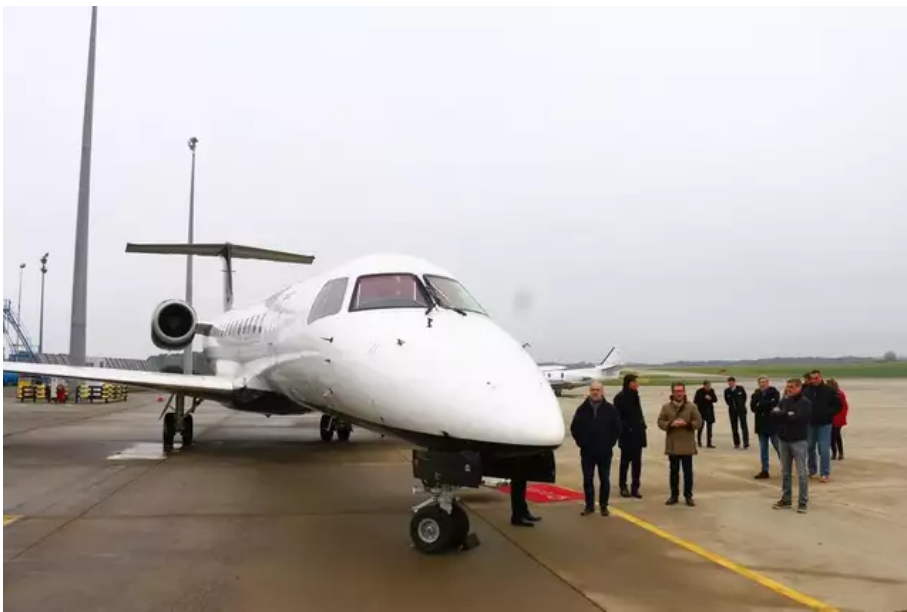
L'ouverture de ces nouvelles lignes aériennes destinées aux professionnels répond aux besoins des entreprises bretonnes, notamment dans l'industrie et l'agroalimentaire.

De Quimper (Finistère) à Vannes (Morbihan) en passant par le bassin de Pontivy (Morbihan), plus d'une centaine d'entreprises situées à 45 minutes à une heure de Lorient sont potentiellement intéressées par cette nouvelle offre de transport aérien. Trois sont notamment intéressées par les lignes vers l'Écosse et la demande vers Lyon devrait permettre la mise en place de trois rotations par semaine.