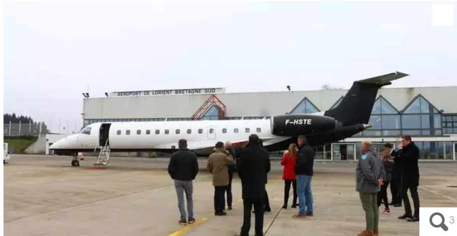
Le premier avion de la société Lorizon s'est posé samedi à l'aéroport de Lorient Bretagne-Sud, le second est attendu pour avril 2023.

La société Lorizon proposera en 2023 des lignes régulières vers Paris, Lyon, Toulon et Inverness en Écosse au départ de Lorient (Morbihan) où deux avions de 37 places seront basés. Des liaisons destinées aux entreprises, mais dont des places seront accessibles aux particuliers.