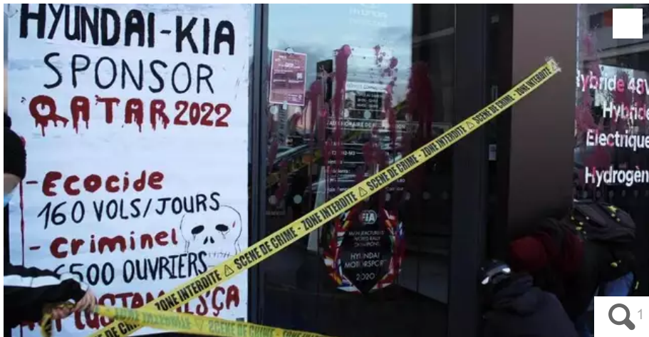
Le groupe nantais d'Extinction Rebellion a visé les concessions Hyundai et Kia.

Le groupe nantais d'Extinction Rebellion a signé une action éclair, ce dimanche 11 décembre, contre deux concessions du groupe Hyundai, à Saint-Herblain.