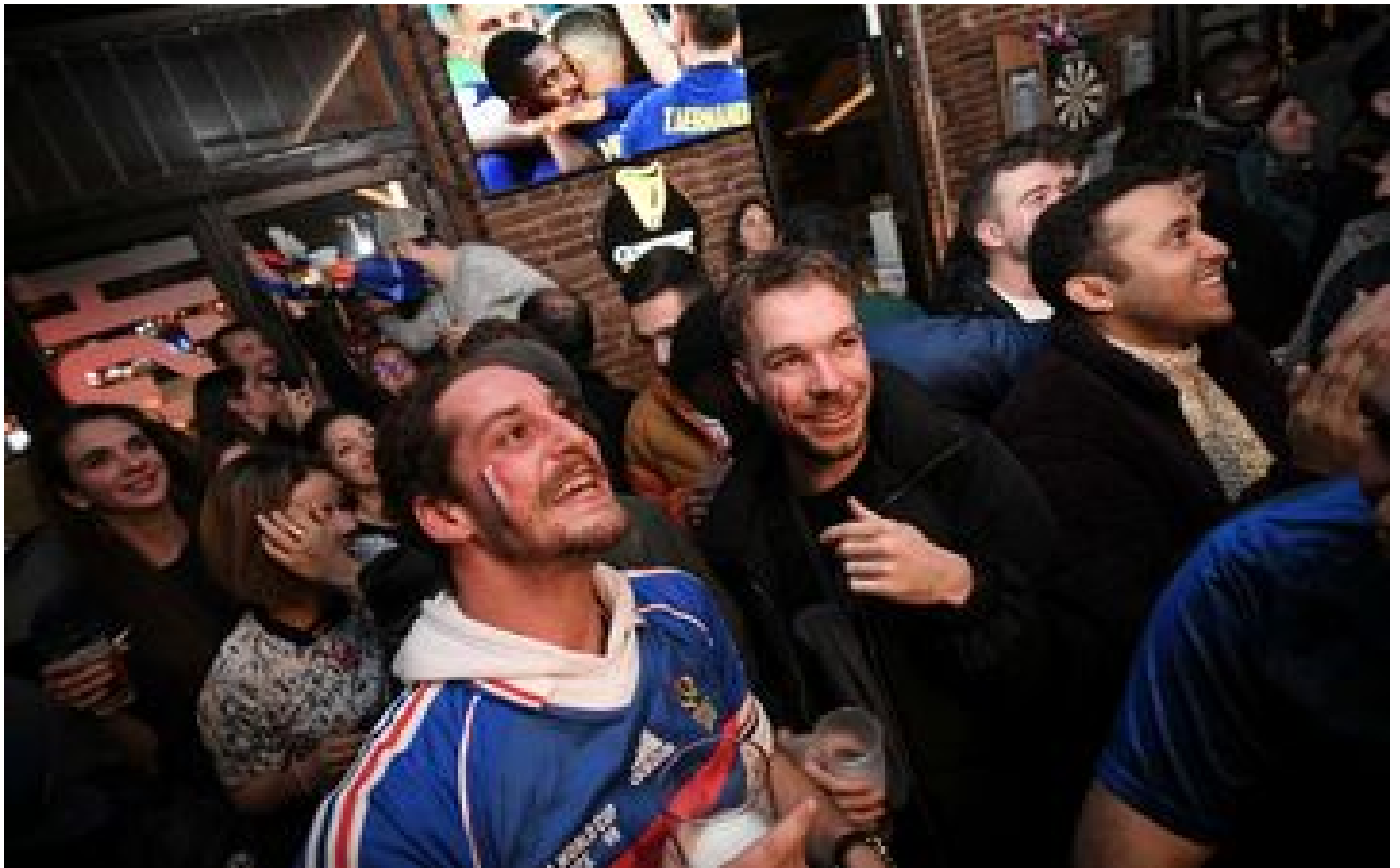
Abonnés Télévisions, bières, pizzas, bars... leur Mondial est déjà une réussite