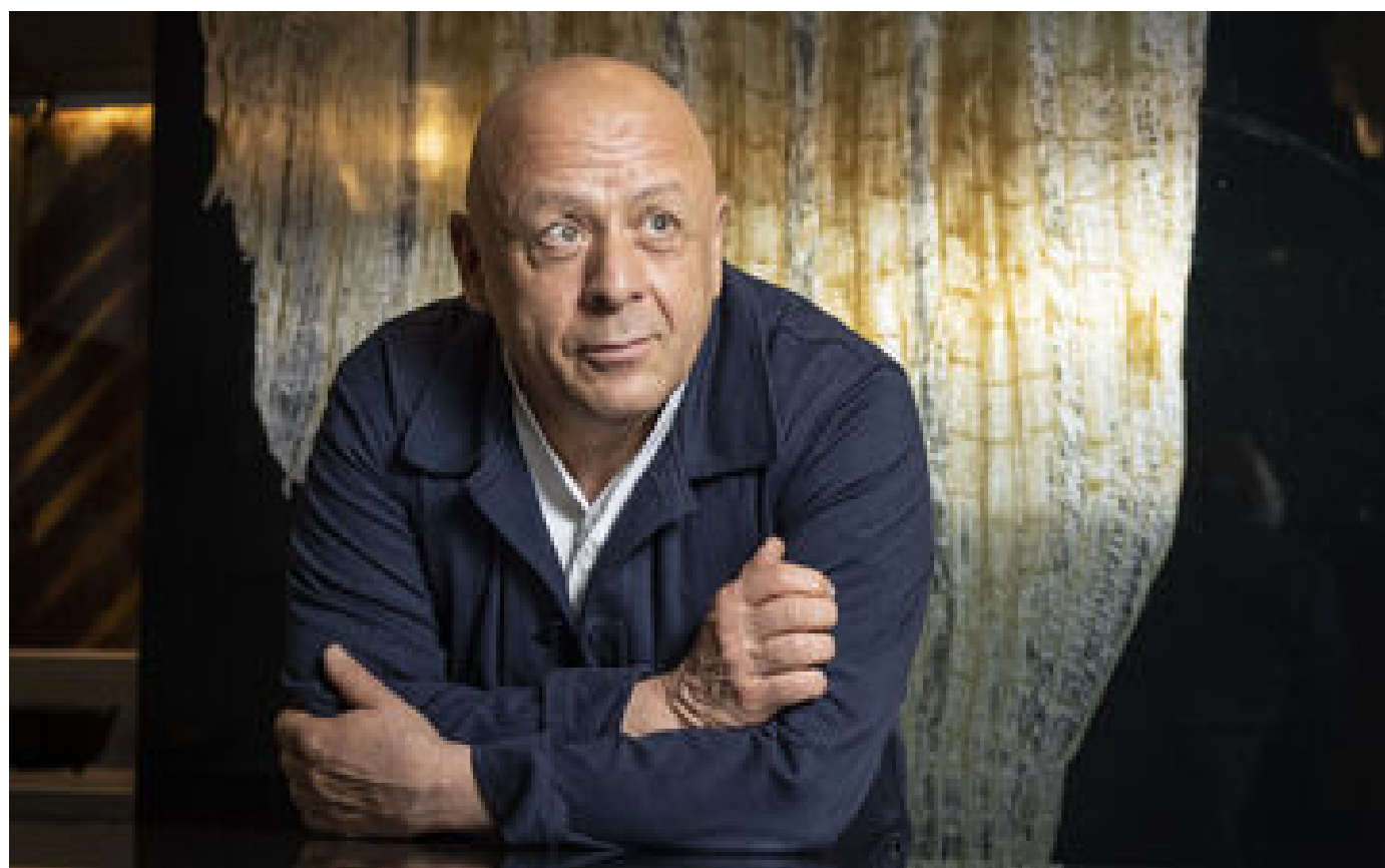
Restauration : Thierry Marx appelle à une «régularisation» de salariés étrangers