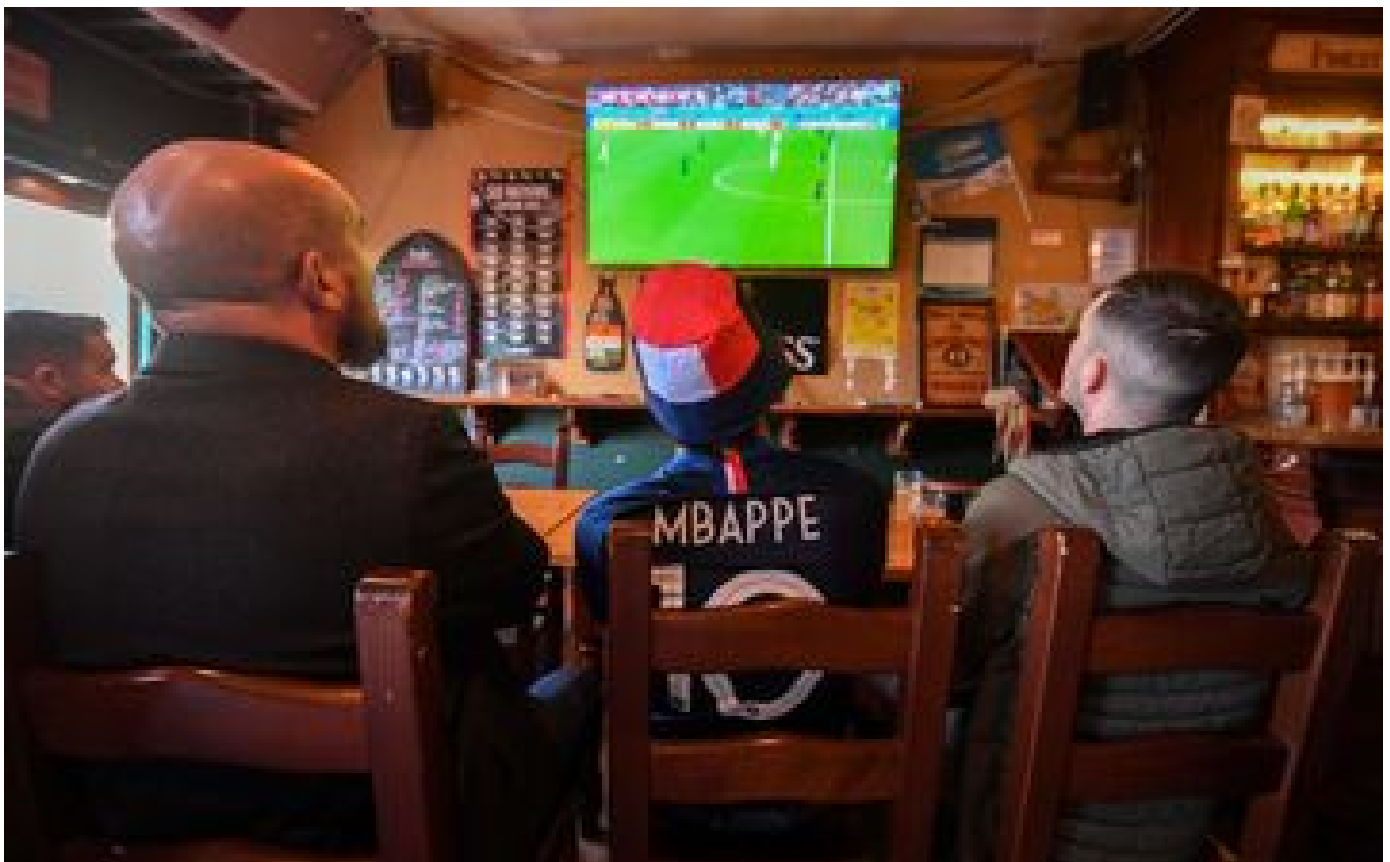
Abonnés Mondial : un beau parcours des Bleus aura «un impact sur le bonheur national brut, plus que sur le PIB»