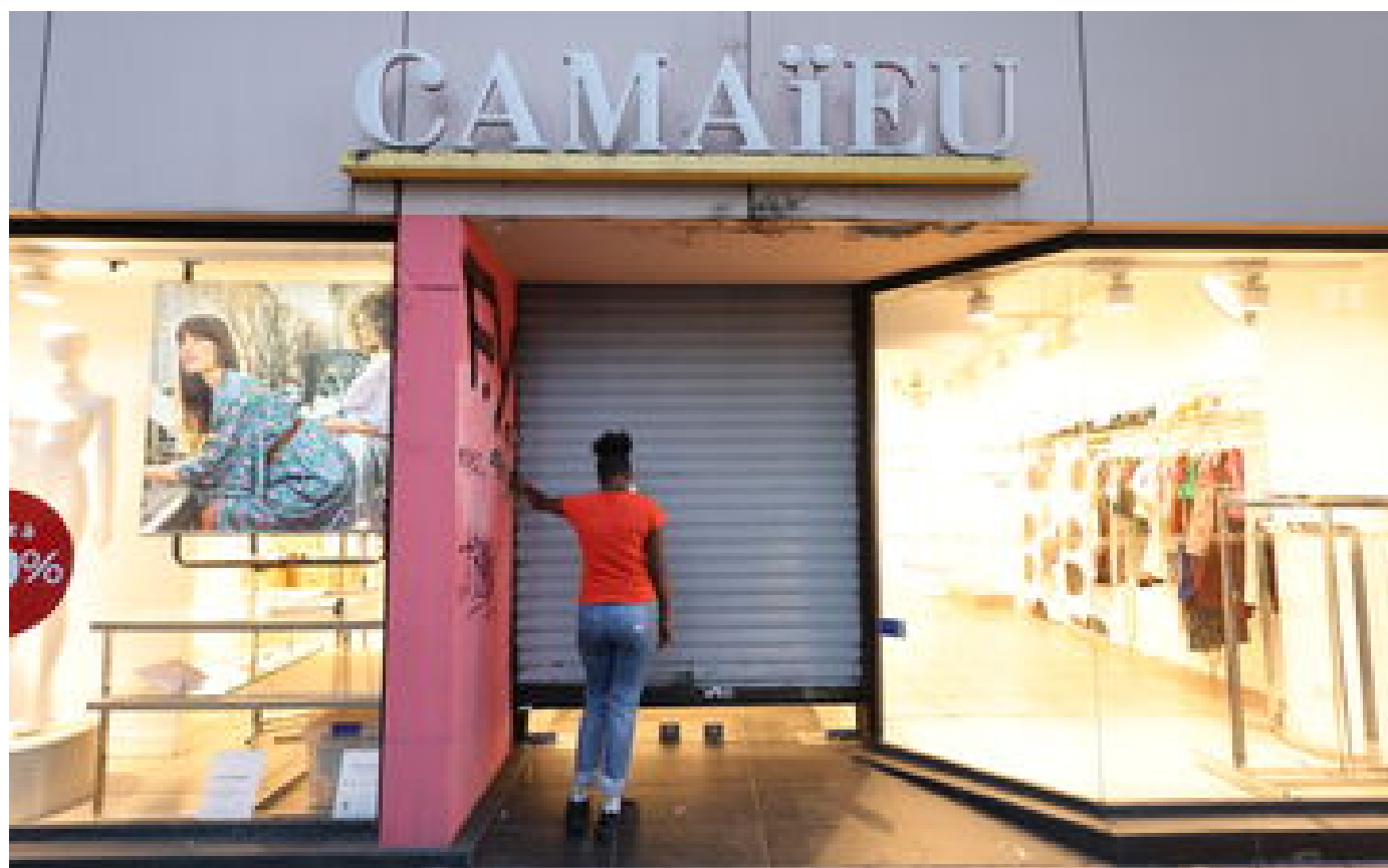
Camaïeu : le fichier clients de la marque, qui réunit «plus de 4 millions de personnes», mis aux enchères