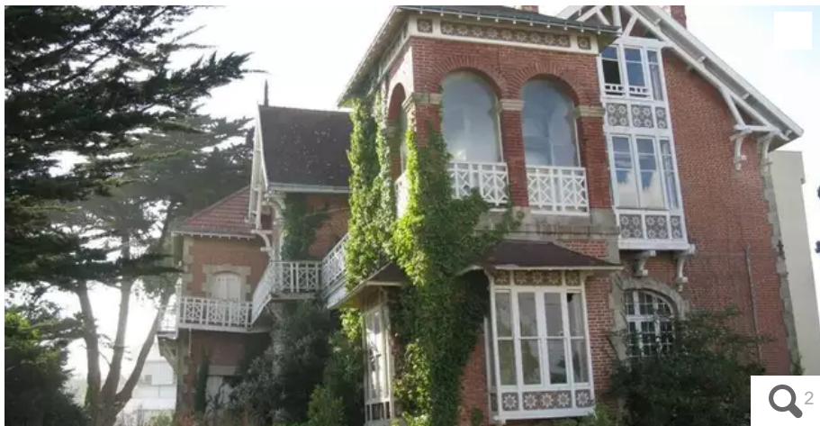
La « villa rouge » bordait la plage de Toulhars, à Larmor-Plage. Menaçant de s'effondrer, elle a été détruite en octobre 2013.

Parce qu'elle menaçait de s'effondrer, la villa Ty Sklerder (plus connue sous le nom de « villa rouge ») a été démolie en 2013. Elle est aujourd'hui au cœur du premier roman de Corinne Le Diraison.