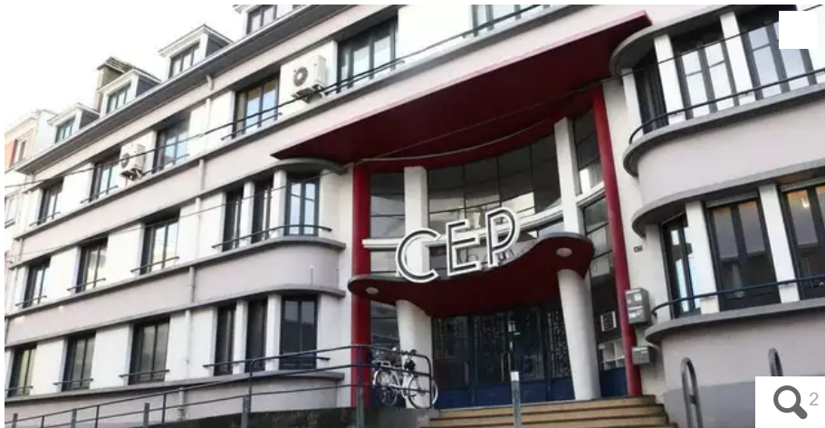
Le siège du Cep, rue Duguay-Trouin, signé Rogé Beauvir.

Rogé Beauvir, émule de Le Corbusier, a signé plusieurs immeubles de la Reconstruction de Lorient (Morbihan). Le service patrimoine et archives de la ville propose une visite sur le terrain dimanche 4 décembre 2022.