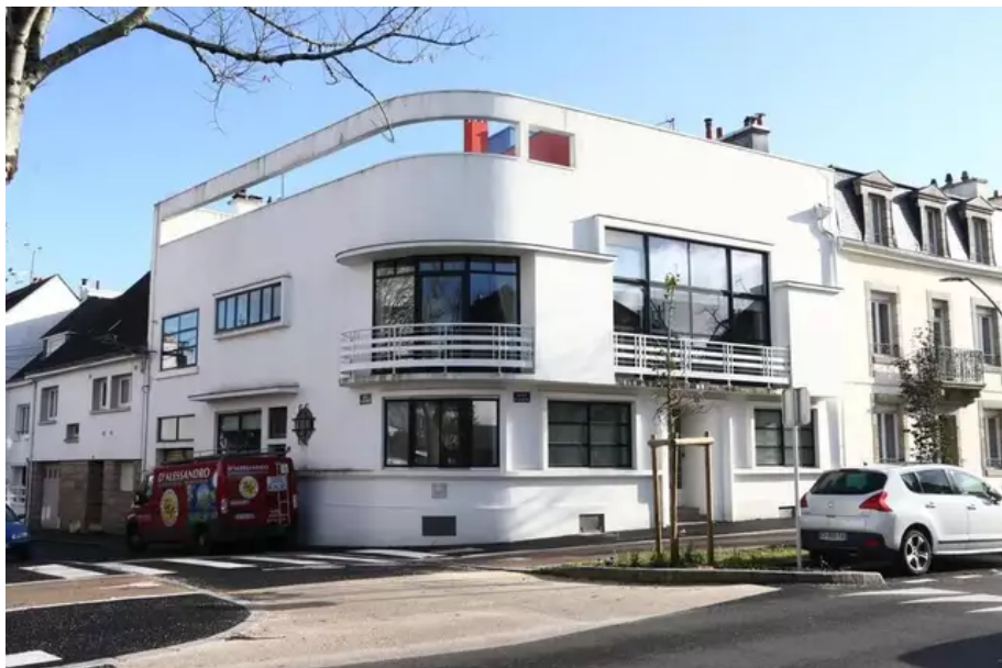
La Villa de la Marne, signée Rogé Beauvir. © OUEST-FRANCE

Le siège du Cep, rue Duguay-Trouin, à Lorient (Morbihan), c'est lui. La Villa de la Marne, au numéro 64, c'est encore lui. Tout comme le bâtiment Kolorian, aujourd'hui déconstruit, qui apportait cette touche art déco dans l'univers industriel du port de commerce. Lui ? C'est Rogé Beauvir. « L'une des figures marquantes de l'architecture de la Reconstruction à Lorient », rappelle le service patrimoine et archives de la ville de Lorient.