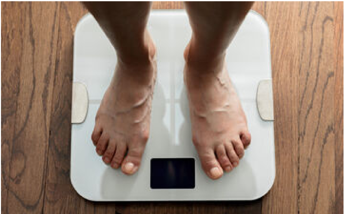
Abonnés Prise de poids : quand faut-il consulter un nutritionniste ?