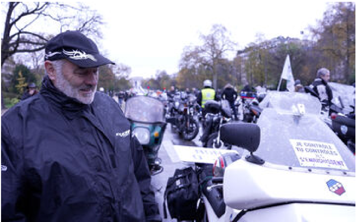
VIDÉO. «Je ne fais pas confiance aux mécaniciens» : les motards manifestent contre le contrôle technique