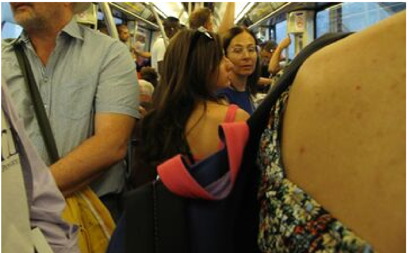
Abonnés Covid-19 : «Tant que le danger n'est pas perçu, les gens ne prennent pas de précaution»