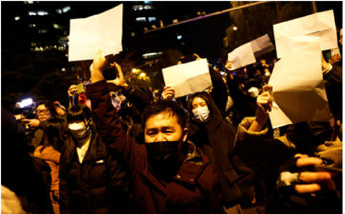
Abonnés «Xi Jinping, démission» : trois ans après le début de la pandémie, la Chine gagnée par la colère