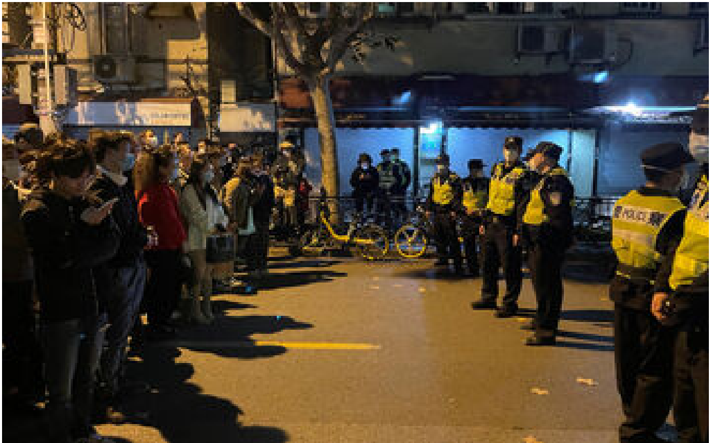
Manifestations en Chine : arrestations, censure, réaction de Pékin... le point sur la situation