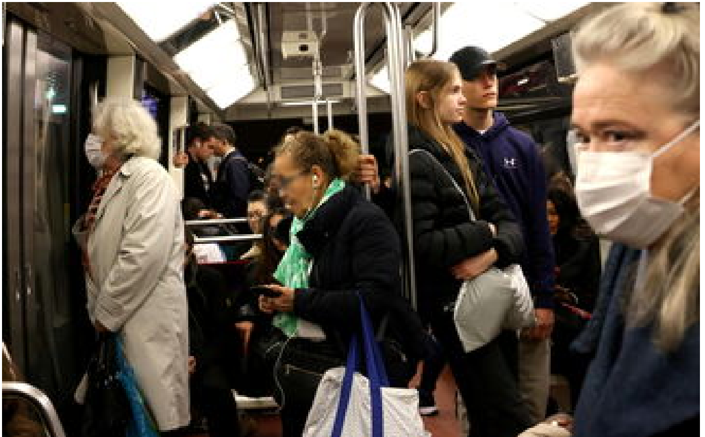
Abonnés Covid-19 : faut-il s'inquiéter de la neuvième vague?