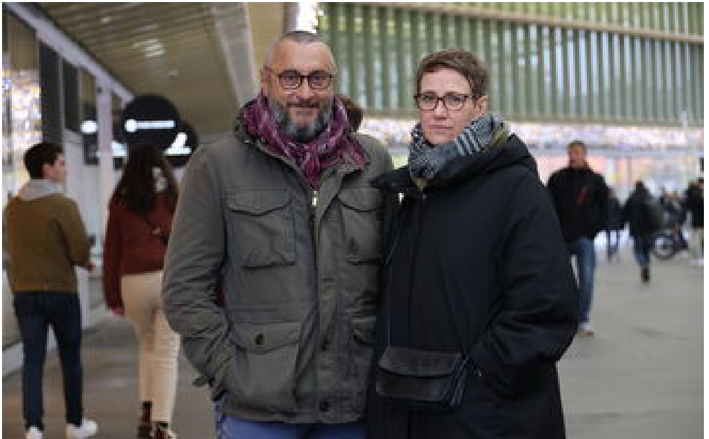
Abonnés «Du gel hydroalcoolique ? Pour quoi faire ?» : quand le Covid n'effraie plus